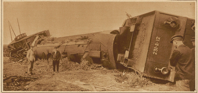
Die umgestürzte Lokomotive des Schnellzuges