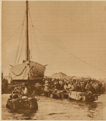
Ein origineller Stapellauf in Spanien. Das Schiff wird von 18 Büffelochsen ins Meer gezogen

Gegen 2 Uhr morgens entgleiste bei Bessay ein Wagen eines Güterzuges. Im gleichen Augenblick brauste aus entgegengesetzter Richtung der Schnellzug Paris-Nîmes heran und fuhr in voller Fahrt auf den entgleisten Wagen auf. Aus den Trümmern wurden 9 Tote und 16 Schwerverletzte geborgen.