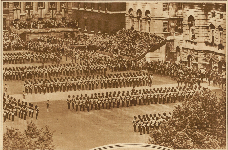
Bild rechts: Die Parade der Garde anlässlich des Geburtstages des englischen Königs