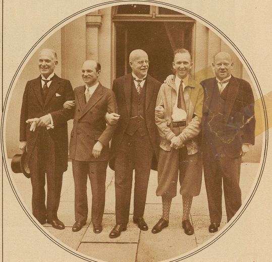
Der Empfang beim deutschen Reichskanzler. Von links nach rechts: Schurman, der amerikanische Botschafter, Chamberlins Begleiter Levine, Reichskanzler Marx, Chamberlin und Außenminister Stresemann