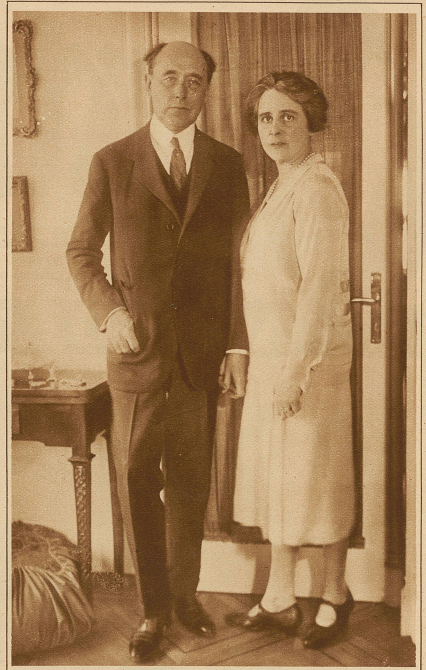
Der bekannte Musiker und Komponist Felix Weingartner mit Gemahlin in seinem neuen Heim in Basel.