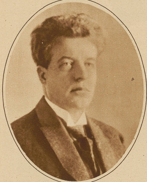
Wojkow, der russische Gesandte in Polen, ist in Warschau durch einen russischen Studenten ermordet worden. Wojkow genoss lange Jahre das Asylrecht der Schweiz und verließ Genf erst im Jahre 1917. Er galt als der eigentliche Urheber der Ermordung der Zarenfamilie.