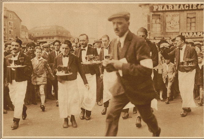
Ein originelles Wettrennen wurde letzten Sonntag von einer Anzahl Kellner in Genf bestritten. Es galt mit einem Servierplateau gefüllter Gläser in möglichst kurzer Zeit eine 2,8 km lange Strecke durch die Stadt zurückzulegen. Unser Bild zeigt einen Moment aus dem Rennen, das vom Publikum natürlich mit größtem Interesse verfolgt wurde.