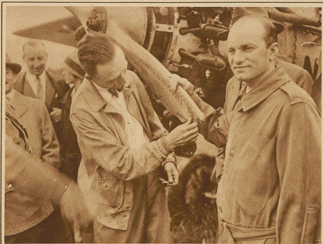
Chamberlins Flug New York – Berlin