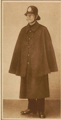
Die neue Uniform der St. Galler Stadtpolizei. Das Käppi ist nach englischem Muster durch einen leichten Filzhelm ersetzt.