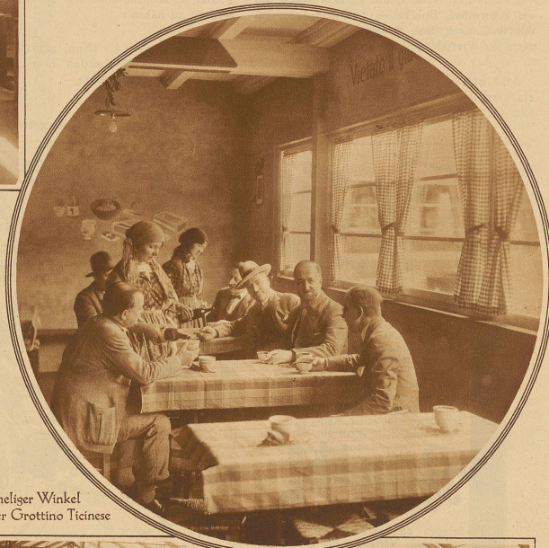
Heimlicher Winkel in der Grotto Ticinese