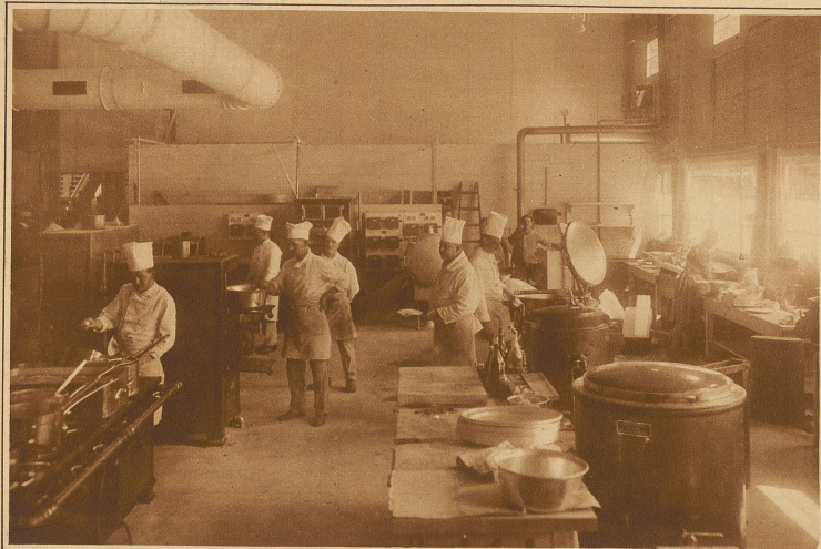
Blick in die Musterküche

Ein schweres Hagelwetter ging am Donnerstag nachmittag über der Stadt Zürich nieder. Die Gemüsekulturen wurden stellenweise vollständig vernichtet. Unsere Aufnahme zeigt ein Straßenbild kurz nach dem Unwetter. Die centimetertief liegenden Hagelschlossen erzeugen einen absolut winterlichen Anblick.