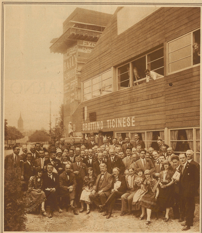
Teilnehmergruppe am Pressetag