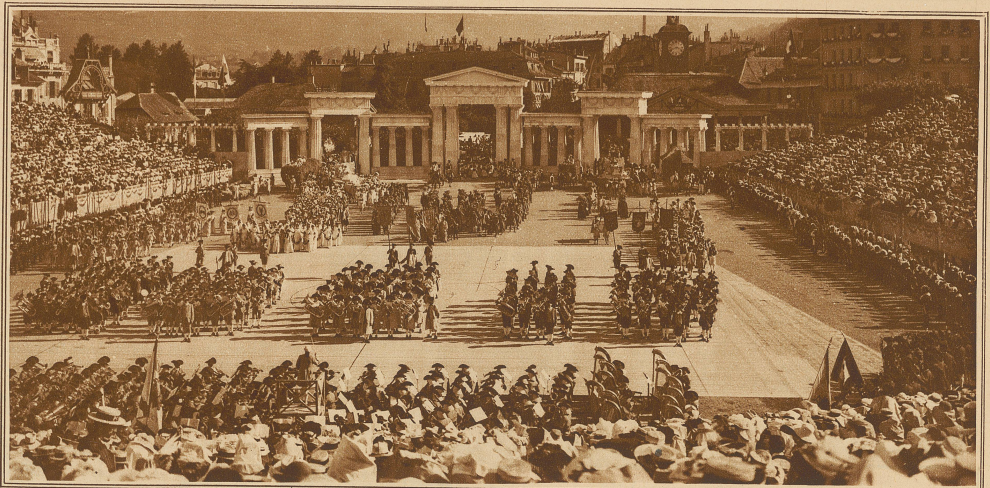
Eröffnungsgruppe im Jahre 1905: Einzug der vier Jahreszeiten