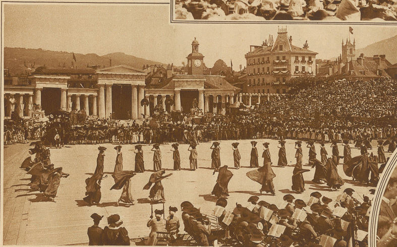
Opfertanz der Bacchantinnen