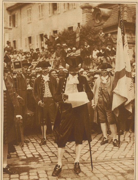
Das Verlesen der Proklamation in den Straßen von Vevey durch den Herold