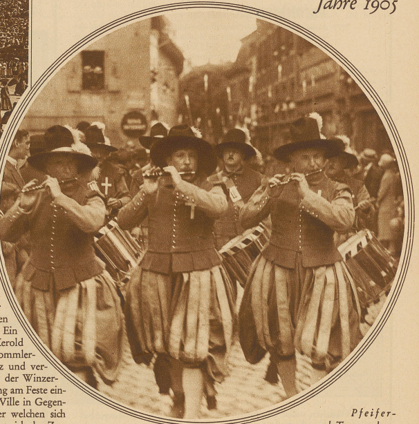
Pfeifer- und Trommlergruppe anlässlich der «Publication» vom letzten Sonntag

In Vevey hat am Sonntag, dem 29. Mai, der erste Auftakt zum diesjährigen Winzerfest stattgefunden mit der offiziellen «Publication» des Festes. Diese von der alten, streng eingehaltenen Tradition vorgeschriebene Ankündigung des Festes muß zwei oder drei Monate vor der eigentlichen Abhaltung erfolgen und zwar unter genau vorgeschriebenen Zeremonien. Ein in der Ratsstrach des 18. Jahrhunderts gekleideter Herold durchschreitet unter Vorantritt einer Pfeifer- und Trommlergruppe die Straßen der Stadt bis nach La Tour-de-Peilz und verliest an bestimmten Stellen die vom Abbé-Präsidenten der Winzerbruderschaft verfaßte Proklamation, die zur Beteiligung am Feste einladet. Die erste Verlesung erfolgt vor dem Hotel de Ville in Gegenwart der städtischen Behörden und Ehrengäste, unter welchen sich diesmal auch Bundesrat Chuard befand. Darauf bewegt sich der Zug unter den abwechselnden Klängen eines Musik- und eines Pfeiferkorps durch die dichtbesetzten Straßen, wobei die Bevölkerung auch Gelegenheit hat, einzelne probeweise zusammengestellte Kostümgruppen aus dem Winzerfeste kennen zu lernen. Der 29. Mai hatte bereits eine große Menschenmenge nach Vevey gelockt, wo die im Rohbau vollendete riesige Festarena einen Begriff vermittelt von dem geplanten Umfang des diesjährigen Winzerfestes. Sie enthält Sitzplätze für mehr als 13,000 Zuschauer.