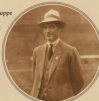
Pelli: 371 + 365 + 333 = 1069 Pkte.