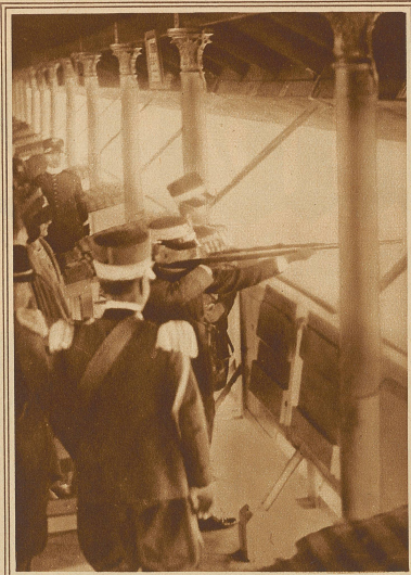
Der König von Italien gibt zum Zeichen der Eröffnung des Schützenmatches den ersten Schuß ab