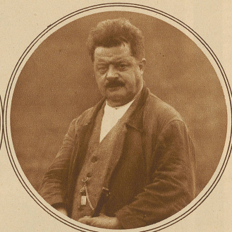
Kuchen: 372 + 349 + 338 = 1059 Pkte.