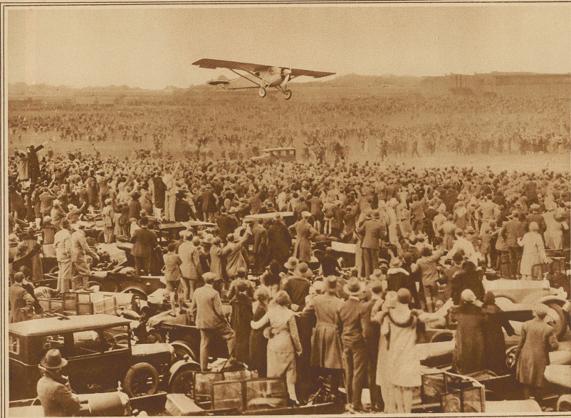
Auch in London wurde der Ozeanbezwinger Lindbergh mit großer Begeisterung empfangen. Kaum war der von Brüssel kommende Apparat in Sicht, durchbrach die nach Hunderttausenden zählende Menschenmenge den Polizeikordon und strömte auf das Flugfeld von Croydon, so daß Lindbergh zur Verhütung eines schweren Unglücks genötigt war, das Flugzeug nochmals hochzunehmen und außerhalb des Platzes zu landen