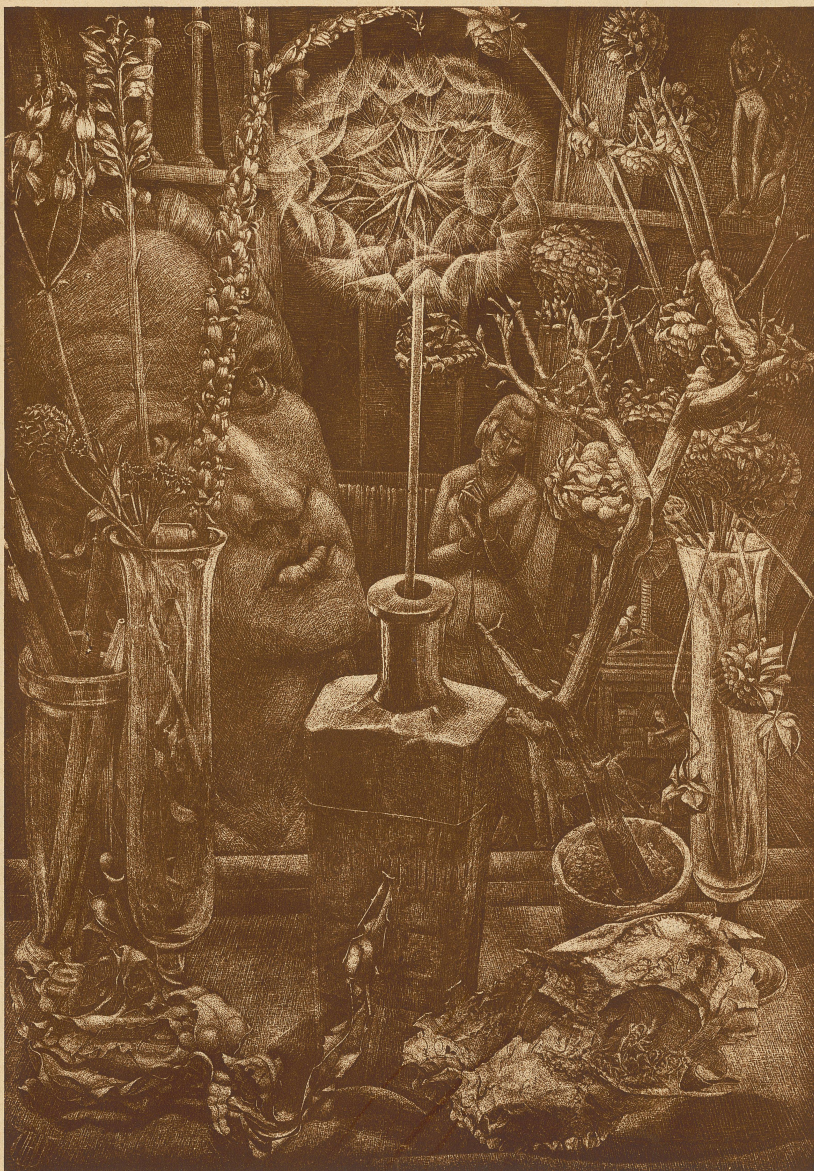
Der abgeblühte Löwenzahn