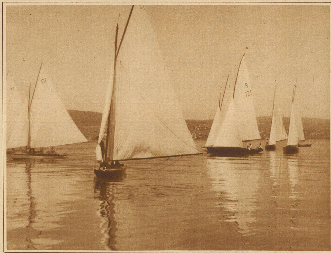
Aus der Distanz: Wettfahrt Kilchberg-Rapperswil der Segler-Vereinigung Kilchberg

Er beschloß, neue Ammonen mit großer Preisermäßigung einrücken zu lassen; vielleicht hatte er zu hohe Honorare beansprucht. Er kam aber nicht zur Ausführung seiner Ansicht, weil ihn