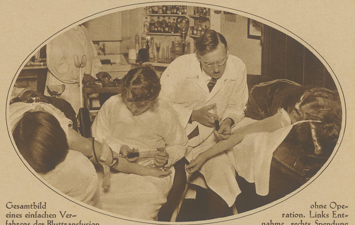
Gesamtbild eines einfachen Verfahrens der Bluttransfusion