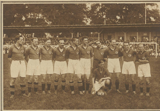
Die Meistermannschaft des F. C. Servette, Genf