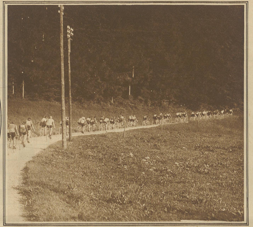
Die Kopfgruppe der Amateur-Senioren vor Bern