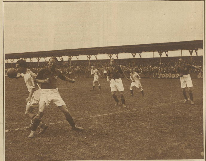
Servette schlägt Grasshoppers 3:2 u. wird Schweizer Meister