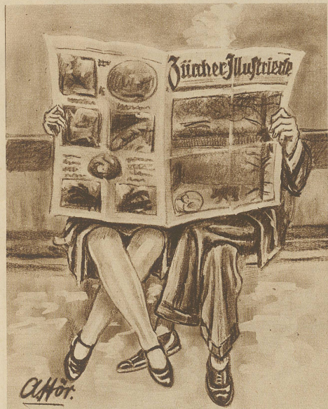
Gesetzt Schaggi, 's Format vo d'r Zürcher Illustrierte isch halt glich no praktisch

Auf Posten. Der General will sich von der Kenntnis der Obiegenheiten des Postens bei einem Pulvermagazin überzeugen und sucht den Mann auf. Er fragt ihn: «Was würden Sie tun, wenn ich mit einer brennenden Zigarre in Ihre Nähe käme?» — «Ich würden den Herrn General ersuchen wegzugehen, weil es nicht erlaubt ist, in der Nähe des Pulvermagazins zu rauchen.» — «Ich gehe trotzdem nicht weg.» — «Dann würde ich den Herrn General noch einmal ersuchen wegzugehen.» — «Ich gehe aber noch immer nicht weg; was würden Sie dann