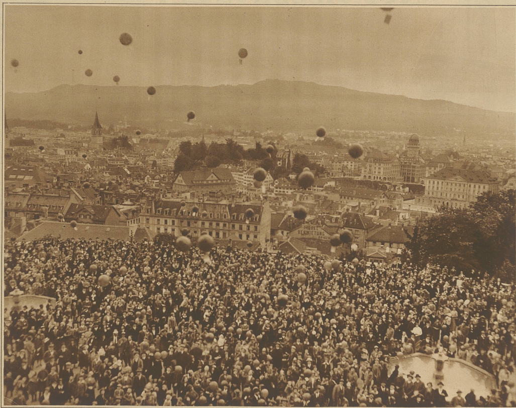
Start zum letzten vom Globus veranstalteten Kinderballon-Wettfliegen auf der Poly-Terrasse in Zürich