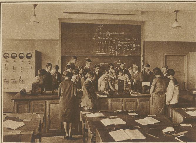
Im Lehrzimmer für Physik