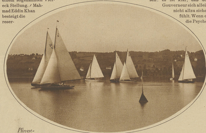
Plingst- Segelregatten in Rapperswil

Etwa hundert Soldaten in roten Uniformen nahmen in einem Viereck, oder vielmehr in einem sogenannten Viereck Stellung. / Mahmud Eddin Khan bestieg die reser-