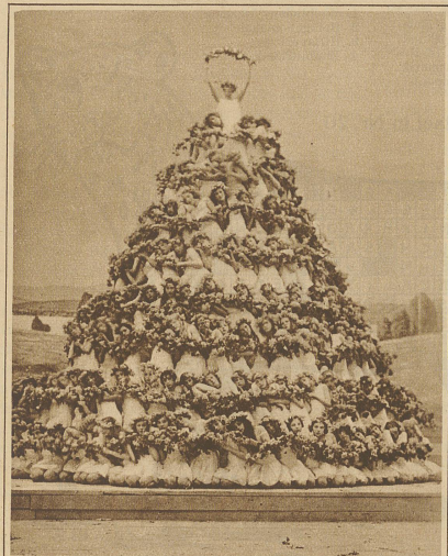
Aus dem Festspiel: «Segen der Arbeit»