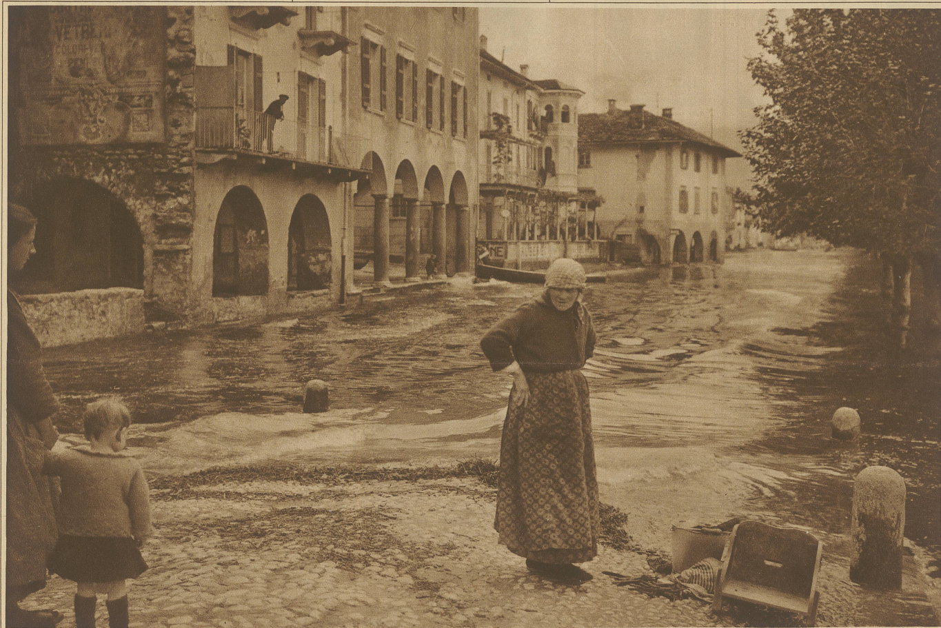
Die Wellen des Lago Maggiore überfluten den am See gelegenen Dorfteil von Ascona