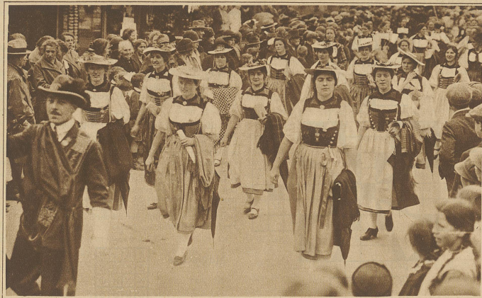
Trachtengruppe aus dem Festzuge