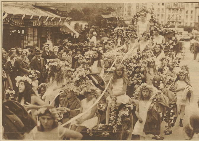
Ein reizender Blumenwagen