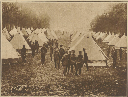
Die Regierung hält das Militär während des Generalstreikes in Bereitschaft. Unsere Aufnahme zeigt ein Lager in Kensington Garden in London