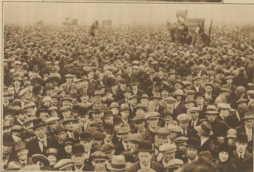
Eine Massendemonstration im Hyde Park in London