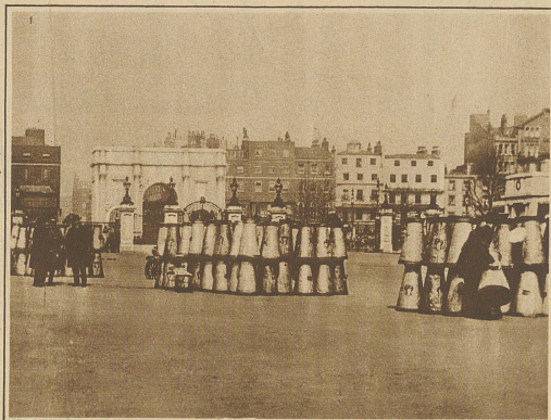
Milchkannen-Pyramiden auf einem öffentlichen Platze der Hauptstadt