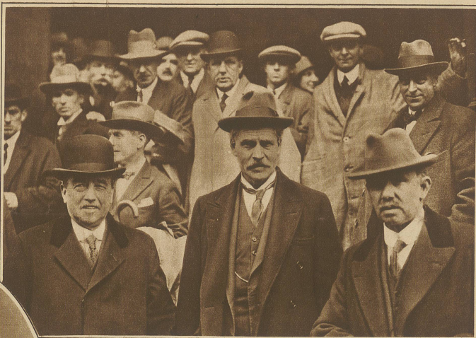
Führende Köpfe der Streikbewegung. Von links nach rechts: Arthur Henderson, Ramsay Mac Donald und J. H. Thomas