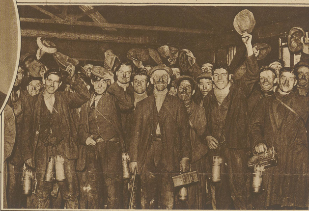
Die letzten Bergleute verlassen die Gruben am Tage des Streikbeginns