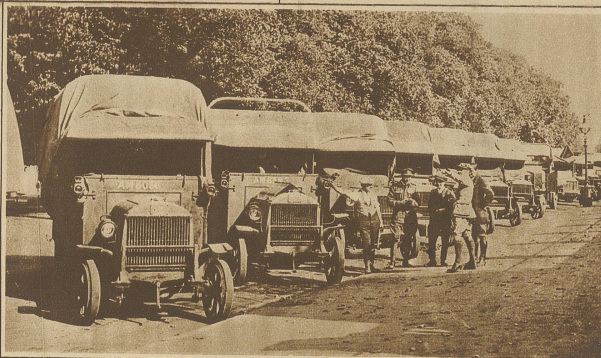
Bild links: Eine Automobil- kolonne zur Auf- rechterhaltung der Lebensmittelver- sorgung in den Städten