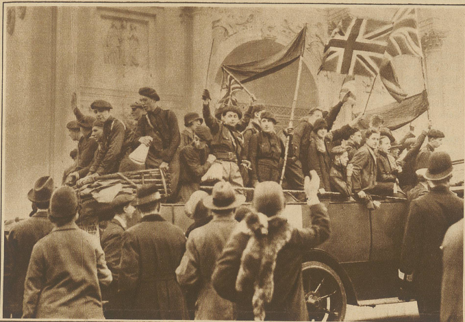
Englische Faschisten auf einem Demonstrationszug zum Hyde Park