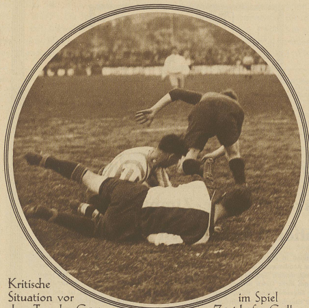
Kritische Situation vor dem Tor der Gäste