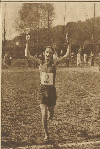
Zanoni, Genf, der Sieger der Kategorie A, im Ziel

Zentralschweizerische Die Amateur-Senioren unterwegs bei Rundfahrt in Aarau Stein-Säckingen