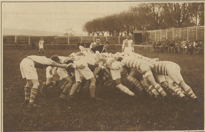
Aus dem ersten in der deutschen Schweiz ausgetragenen Rugbyspiel Grasshoppers-Heidelberg