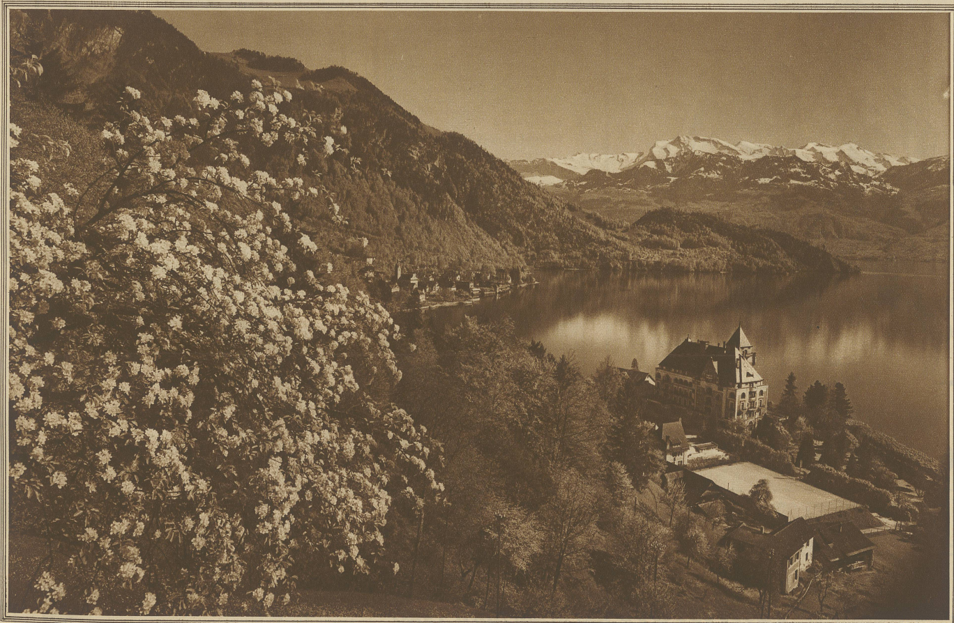
Frühling am Vierwaldstättersee

Gleich hatten ein Dutzend Fäuste den Spielmann am Kragen und schleppten ihn, der verzweifelt mit seiner Geige um sich schlug, zum Wirtsgarten hinaus und durch die Gassen und Gäßchen zum Stadtgericht. Indes alle Gäste, um von dem Schauspiel nichts zu versäumen, hinterdrein liefen und der Wirtsgarten bald als ein greuliches Schlachtfeld dalag, auf dem der Wirt freilich nicht als Sieger geblieben. Denn gezahlt hatte keiner. Da es nun ohne Zweifel sogleich eine Hinrichtung gab, weil man damals die Diebe noch henkte, nach einer solchen Belustigung aber das Volk nicht bei ihm, dem Torwirt, einzukehren pflegte, sondern bei sei-