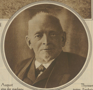
August eine der markan- tungen der deutschen Alter von 86 Jahren gestorben

Thyssen testen Erschei- Großindustrie, ist im