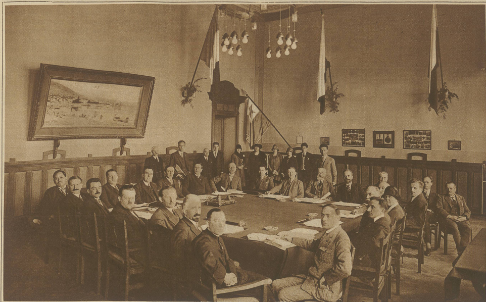
Die Teilnehmer am internationalen Esperantisten-Kongress der letzten Woche im