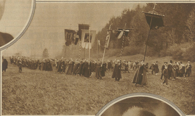
Die Prozession über das Schlachtfeld

Alljährlich am ersten Donnerstag im April begehen die Glarner, als Gedenkfeier an die Schlacht-tage von 1889, die Näfelserfahrt. 11 granitene Gedenksteine bezeichnen die Orte der 11 Angriffe jener Schlacht. Der feierliche Aufzug beginnt in Schneidingen und bewegt sich dann von Stein zu Stein bis gegen Mühlhäusern. Interessant ist, daß sich aus jedem Hause ein Mann an der Fahrt beteiligen soll und daß es gesetzlich erlaubt ist, durch Privatwege und Gärten zu gehen, denn die Erinnerungssteine befinden sich meistens auf Privatgrund, einer sogar in einer Scheune