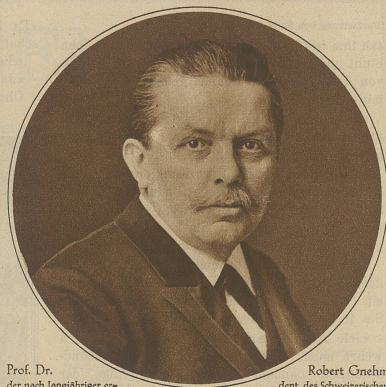
Prof. Dr. der nach langjähriger erfolgreichster Tätigkeit als Präsi-

historisch gewordenen Konferenzsaal in Locarno