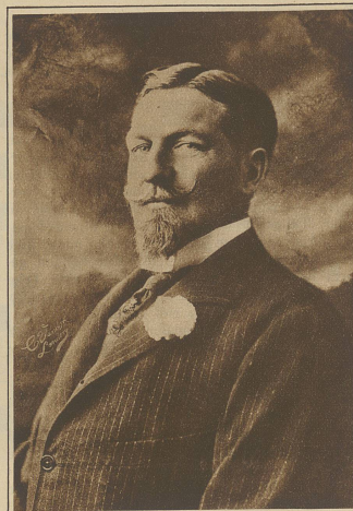
Herzog Philipp von Orleans, der Anwärter auf die französische Kaiserkrone, ist im Exil gestorben