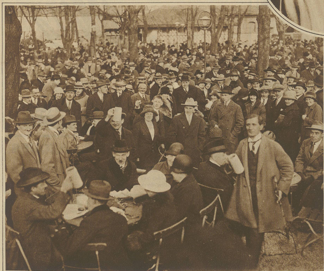
München im Banne des Salvatorbieres. Alle großen Bierhallen sind täglich bis auf den letzten Platz überfüllt. Die begeisterten Münchener Biertrinker schrecken sogar, trotz der Kälte, nicht davor zurück, im Freien ihren unermesslichen Durst zu stillen

In eingeweihten Kreisen erwartet man demnächst die Verlobung des italienischen Kronprinzen Humbert mit der erst 20jährigen belgischen Prinzessin Marie José