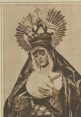
Detailbild aus dem Heiligtum »Die Madonna von Reglia« in der Karfreitagsprozession in Sevilla