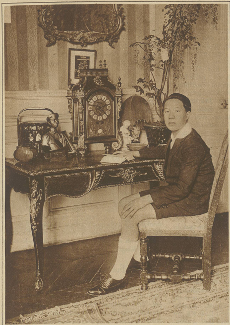
Der junge, erst 12jährige Kaiser von Anam, Bao Dai, ist zur Fortsetzung seiner Studien nach Paris zurückgekehrt. Unser Bild zeigt ihn in seiner neuen Wohnung. Die Bronzebüste auf dem Tisch ist ein Andenken an seinen kürzlich verstorbenen Vater