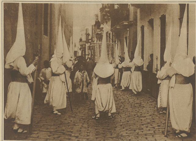
Die verummten Mitglieder der Bruderschaft durchziehen die engen Straßen von Sevilla