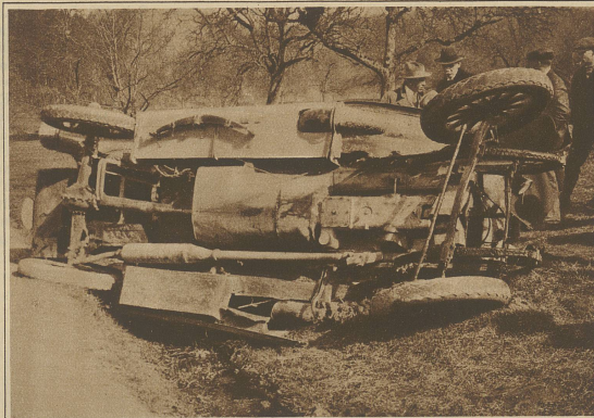
Zum Autounfall auf der Waldegg bei Birmensdorf Der dem österreichischen Generalkonsul in Zürich gehörende Wagen fuhr anlässlich einer Probefahrt mit großer Geschwindigkeit über die Straßenböschung und wurde stark beschädigt. Die beiden vorderen Insassen erlitten beim Sturz schwere Verletzungen