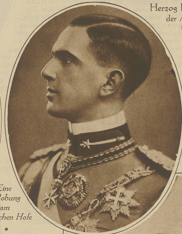
Eine Verlobung am italienischen Hofe

In eingeweihten Kreisen erwartet man demnächst die Verlobung des italienischen Kronprinzen Humbert mit der erst 20jährigen belgischen Prinzessin Marie José