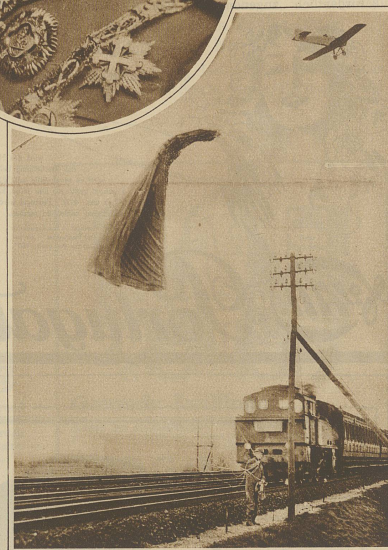
Eine gefährliche aber noch glücklich abgelaufene Landung mußte kürzlich ein Berliner Fallschirmjäger vornehmen. Er sprang aus 850 Meter Höhe glücklich ab, wurde jedoch vom Winde auf die Gleise einer Bahnlinie getrieben, wo sich der Fallschirm in den Telegraphendrähten verlor. Ein im selben Moment die Strecke passender Eisenbahnzug konnte noch rechtzeitig zum Halten gebracht werden