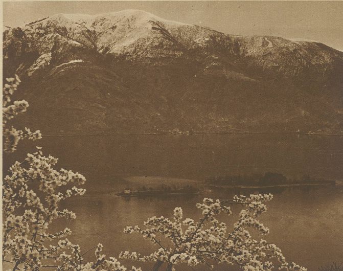
Blick auf die Inseln von Brissago am Lago Maggiore

«Ich bin Coyote-Iguana.» Sie öffnete schnell und glücklich die Augen.