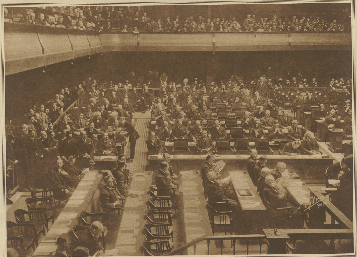
Die Eröffnungssitzung im Genfer Reformationssaal