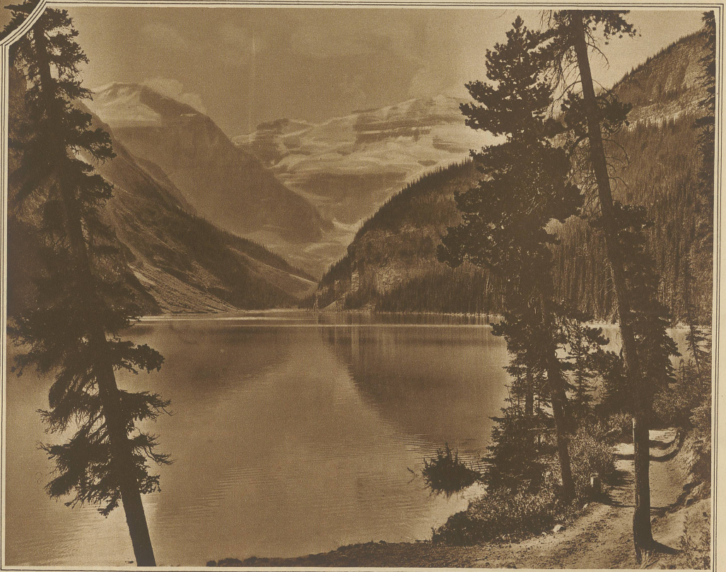
Blick auf den Lake Louise vom Hotelpark aus