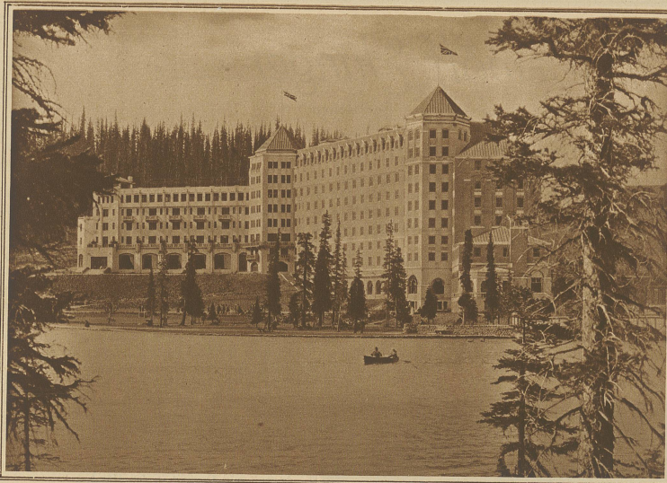
Das neue Hotel «Château Lake Louise». Es wurde im Winter 1924/25 mit einem Kostenaufwand von annähernd 13 Millionen Franken erbaut. Der großen Kälte wegen, die oft bis 50 Grad unter Null erreichte, mußte der ganze Bau innerhalb einer gewaltigen Holzverschalung, die unter ständiger Dampfheizung stand, vorgenommen werden. In Lake Louise findet sich jeden Sommer eine kleine Schweizerkolonie zusammen, die als Köche, Metzger, Zuckerbäcker und sonstige Hotelangestellte Anstellung findet und ihrer allgemeinen Tüchtigkeit wegen beliebt ist. So zählte die Kolonie letzte Saison über 30 Schweizer und Schweizerinnen.