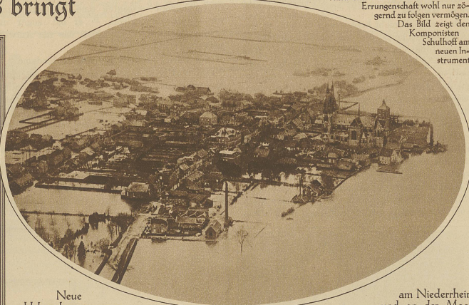
Neue Ueberschwemmungen am Niederrhein und an der Maas Flugzeugaufnahme des holländischen Städtchens Cuyk, das vom Hochwasser der Maas völlig eingeschlossen ist