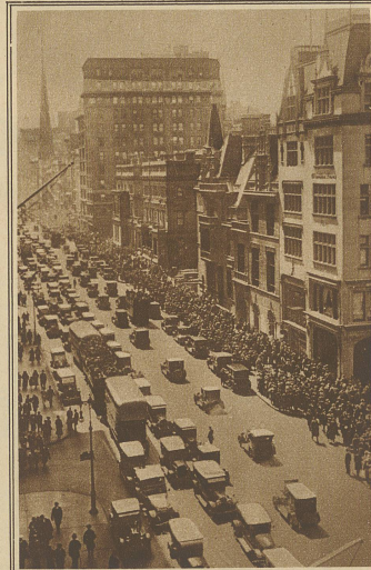
Blick in die Park Avenue in New York, die als die Straße mit der höchsten Automobilfrequenz gilt. Am Kreuzungspunkt der Park Avenue mit der berühmten Fifth Avenue wurden kürzlich folgende Zahlen notiert: Pro Minute passierten die Park Avenue 48 Automobile, während die "Fünfte" im gleichen Zeitraum nur von 40 durchfahren wurde. Zwischen 7 Uhr früh und 7 Uhr abends verkehrten an den Zählstationen 55597 Wagen in der Park Avenue und 23532 in der Fifth Avenue