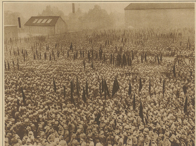
Ueber 100000 Reichsbanner-Leute aus allen Gauen Deutschlands trafen sich letzten Sonntag zur zweiten Bundesgründungsfeier. Unser Bild zeigt einen Blick auf die Versammlung mit den unzähligen Fahnen auf dem Sportplatz vor dem Lübecker Tor