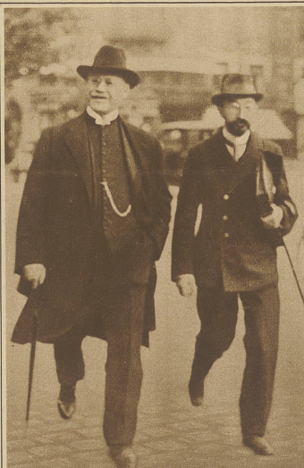
Ein dänischer Bischof wegen Geldbetrügereien angeklagt. Vor dem Landesgericht in Kopenhagen findet diesen Monat der Prozeß gegen Anton Bast, den Bischof der methodistischen Gemeinde, statt, der ihm anvertraute Gelder statt zur Unterstützung armer Leute für seine eigenen Bedürfnisse verwendete. Ebenso gingen große Summen durch mangelhafte Buchführung verloren. Bischof Anton Bast (links) mit seinem Verteidiger