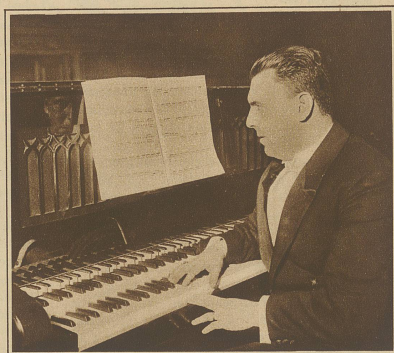
Letzte Woche fand in Berlin das erste Konzert mit dem Vierteltonklavier statt. Unser Ohr wird dieser neuesten Erfindung wohl nur zögernd zu folgen vermögen. Das Bild zeigt den Komponisten Schulhoff am neuen Instrument