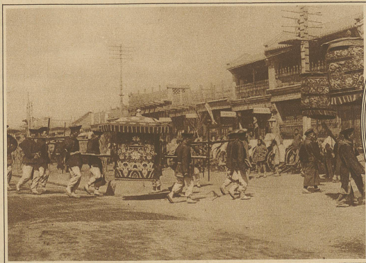
Eine bürgerliche Hochzeit, die immer noch mit altem Pomp und zeremoniellen Bräuchen gefeiert wird