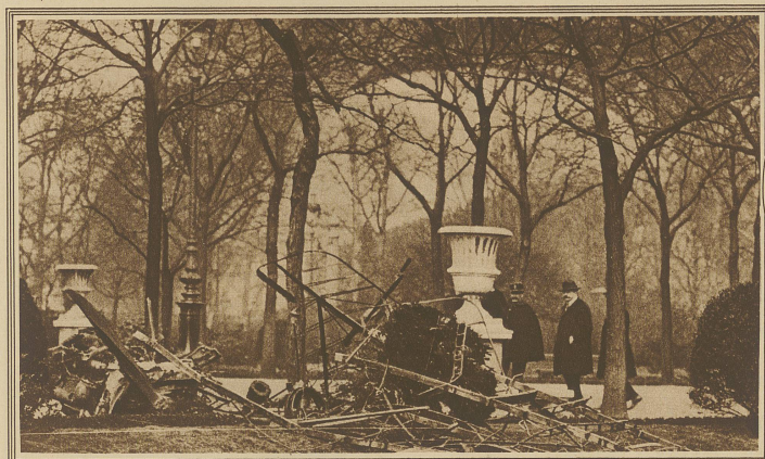
Auf Grund eines Vertrages mit einem Filmunternehmen versuchte am Mittwoch der französische Militärflieger Collet unter dem Bogen des Eiffelturmes hindurchzufliegen. Das Waggestück gelang ihm auch, doch fiel der Apparat beim Wiederaufrichten gegen eine Antenne des Radioturmes auf dem Marsfeld und stürzte ab. Der Flieger wurde als verkohlte Leiche unter den Trümmern hervorgezogen. Unser Bild zeigt den zertrümmerten Apparat und im Hintergrund den Bogen des Eiffelturmes