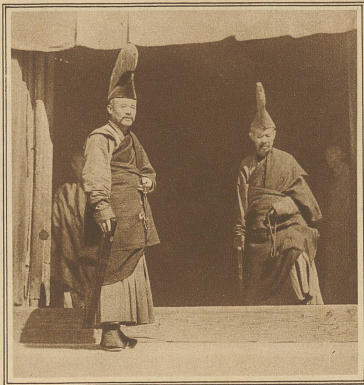
Zwei hohe buddhistische Würdenträger