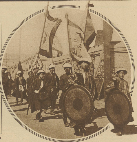
Aus dem Begräbnis eines chinesischen Generals