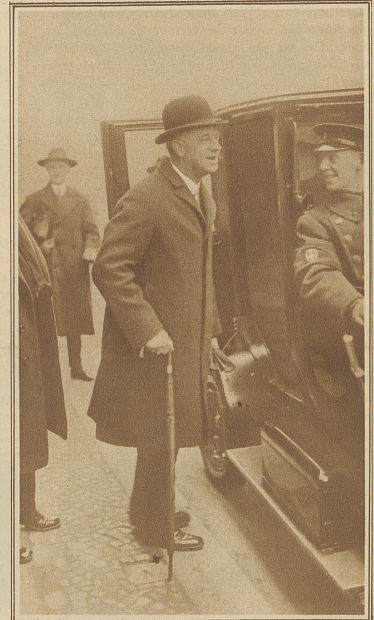
Sir Drummond, der Generalsekretär des Völkerbundes, bei seiner Ankunft in Berlin, wohin er sich zur Besprechung einiger Fragen, die mit dem Eintritt Deutschlands in den Völkerbund zusammenhängen, begeben hat