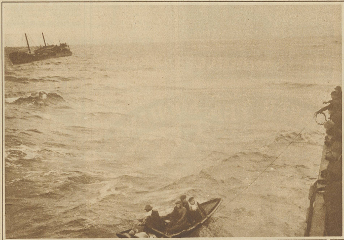
Das stürmische Wetter der letzten Tage hat eine große Anzahl Schiffe in schwere Seenot gebracht. Unser Bild zeigt im Hintergrund den norwegischen Dampfer «Pinto», dessen Besatzung kurz vor Versinken des Schiffes vom amerikanischen Dampfer «Caspar» aufgenommen werden konnte. Im Vordergrund: Einholen des letzten Rettungsbootes