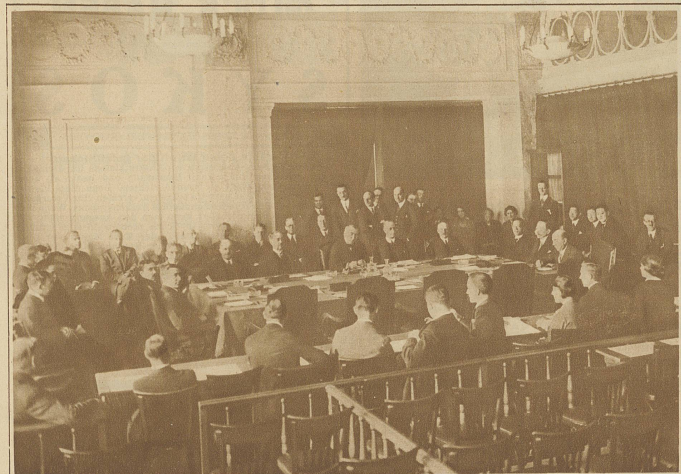
Die Sitzung des Völkerbundsrates vom 12. Februar in Genf, anlässlich welcher über den Eintritt Deutschlands und über die Erhöhung der Zahl der ständigen Ratsmitglieder diskutiert wurde