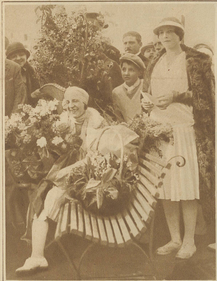
Nach dem sensationellen Tennismatch in Cannes. Sitzend: die Siegerin Suzanne Lenglen, hinter ihr die amerikanische Meisterin Helen Wills