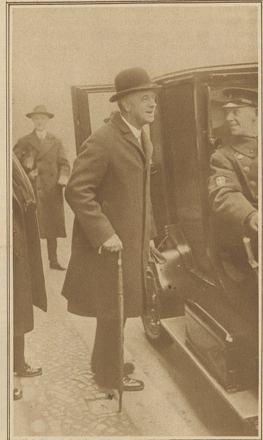
Sir Drummond, der Generalsekretär des Völkerbundes, bei seiner Ankunft in Berlin, wohin er sich zur Besprechung einiger Fragen, die mit dem Eintritt Deutschlands in den Völkerbund zusammenhängen, begeben hat