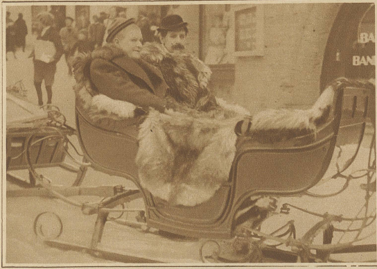
Die beiden berühmten dänischen Filmkomiker Pat und Patachon auf einer Spazierfahrt in St. Moritz