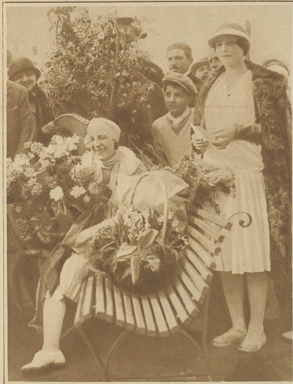
Nach dem sensationellen Tennismatch in Cannes. Sitzend: die Siegerin Suzanne Lenglen, hinter ihr die amerikanische Meisterin Helen Wills