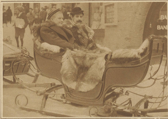
Die beiden berühmten dänischen Filmkomiker Pat und Patachon auf einer Spazierfahrt in St. Moritz