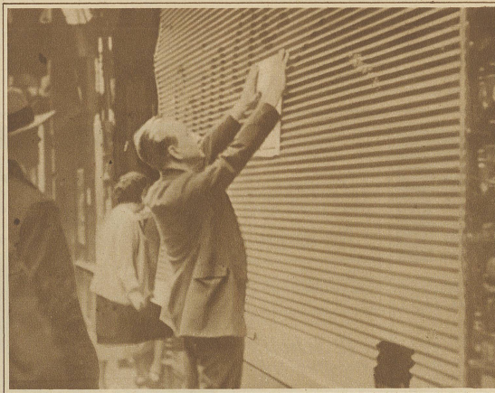
Ein Proteststreik der Pariser Kaufleute. Ein Ladenbesitzer schließt sein Geschäft zum Protest gegen die neuen Steuergesetze