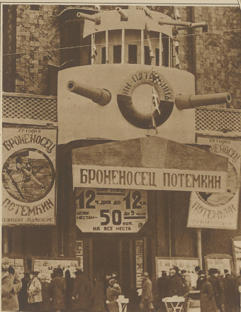
Originelle Reklame eines Kinos für den russischen Film 'Potemkin'