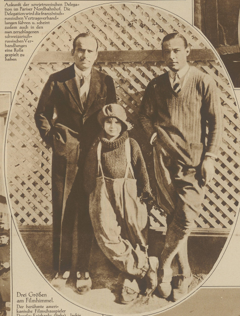
Drei Größen am Filmhimmel. Der berühmte amerikanische Filmschauspieler Douglas Fairbanks (links), Jackie Coogan und Rudolf Valentino während einer Erholungspause in Hollywood