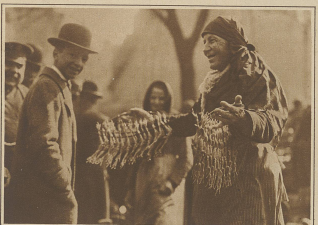
Mädchen im Zeichen der Fastenzeit. Verkauf von Frochschenkeln auf offenem Markte