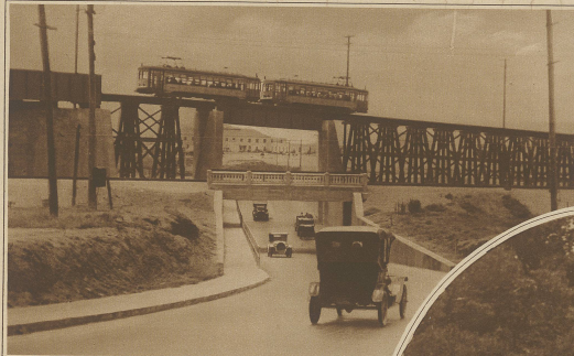
Eine fähige Verkehrskonstruktion, bei welcher Auto, Eisenbahn, Hochbahn und Fußgänger auf ihren sich kreuzenden Wegen unbehindert verkehren können