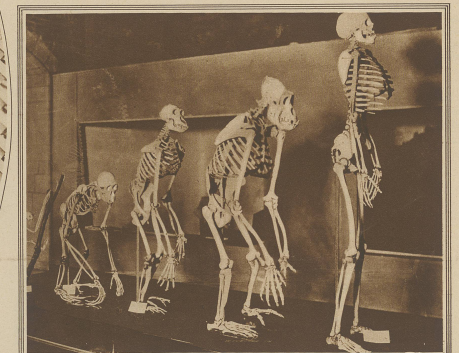
Aus einem amerikanischen Museum der Entwicklungslehre, die bekanntlich den Menschen als Entwicklungsprodukt der Affen darstellt. Von links nach rechts: Gibbon, Orang-Utan, Schimpanse, Gorilla und Chicagoer Bandit