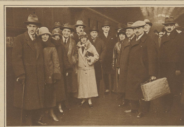
Ankunft der sowjetrussischen Delegation in Paris Nordbahnhof. Die Delegation wird die französisch-russischen Vertragsverhandlungen führen. In diesem Zusammenhang sind auch in den aussergewöhnlichen sowjetisch-russischen Verhandlungen eine Rolle gespielt zu haben