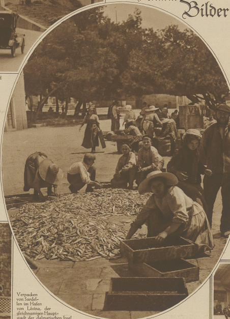
Verpacken von Sardellen im Hafen von Lissabon, der gleichzeitigen Hauptstadt der portugiesischen Insel