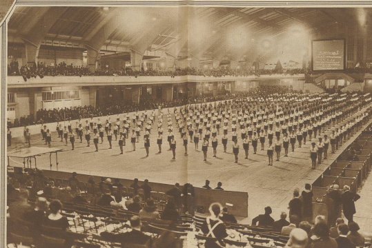
Aus einem großen Berliner Hallensportfest. Eine eindrucksvolle Demonstration für das Frauenturnen