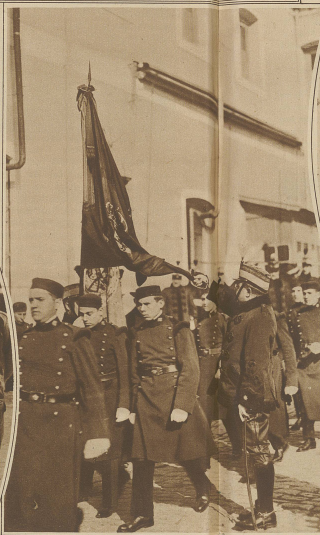
Der Fahnenstiel in Spanien. Neu eingezogene Rekruten der spanischen Armee leisten den Treueschwur, indem sie zu zweit unter der von einem Offizier gehaltenen Fahne hindurchmarschieren