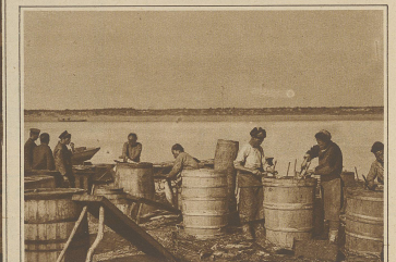
Eine Lachsfißerei am Ufer des Amur. Chinesische Arbeiter füllen die Fische in Holzfässer