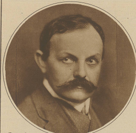
General der Generalstab der tschechischen Armee, ist vom obersten militärischen Ehrenrat wegen einer Skandalgeschichte seines militärischen Ranges verbannt worden