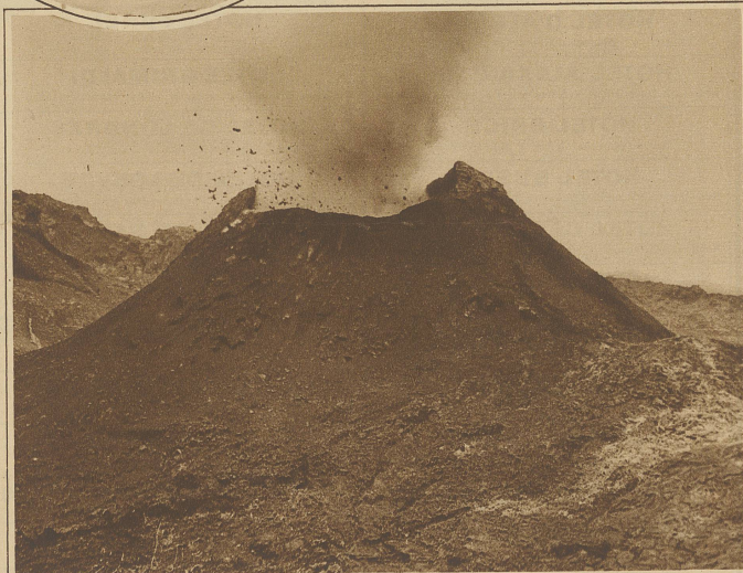
Ein Momentbild vom neuen Ausbruch des Vesuv. Der im alten Krater entstandene Feuerschlund in voller Tätigkeit