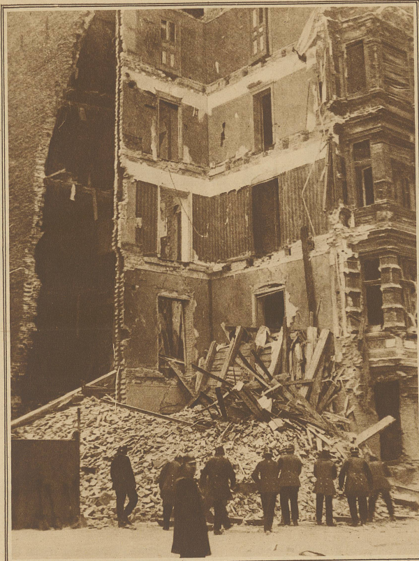
Die Trümmer des eingestürzten Hauses, unter welchen 9 Tote und 33 mehr oder weniger schwer Verletzte hervorgezogen wurden