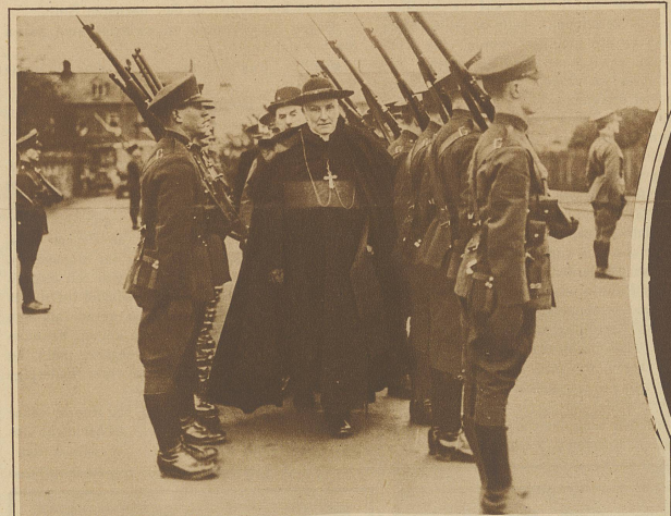
Der neue Kardinal von Irland schreitet auf dem Gang zur Kathedrale die Front der Ehrenkompanie ab