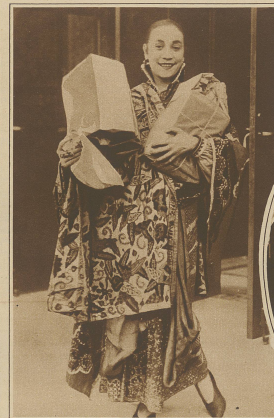
Die bekannte jamaikanische Tänzerin und Frauen-Talk-Queen, welche in Berlin, bevor sie gegenwärtig gastiert.