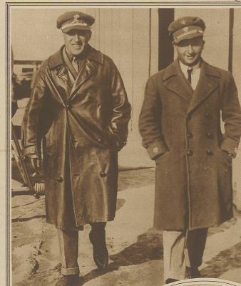
Die beiden spanischen Militärflieger, Major Ramon Franco und Hauptmann Ruiz de Alde, beabsichtigen nach dieser Mission im Flugzeug den Atlantischen Ozean von Cadix nach Buenos Aires zu überqueren.