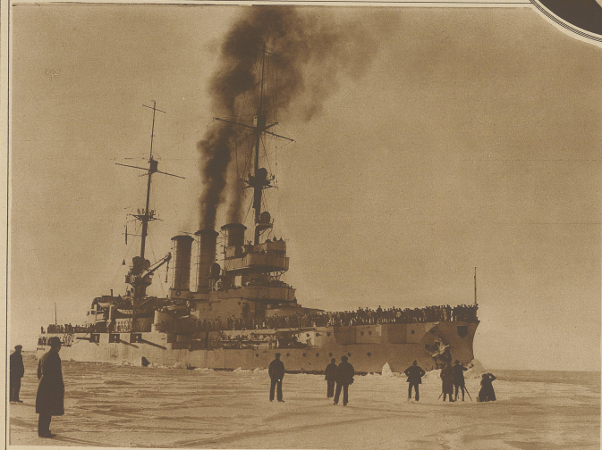
Mit Voldampf durch die vereiste Ostsee. Das deutsche Linienschiff «Hessen» unterwegs zur Befriedung und Verproviantierung auf offener See eingetragener Handelsschiffe.