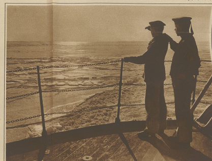
Stimmungsbild an Bord des Linienschiffes. Auf der Aussicht nach hilfsbedürftigen Schiffen.