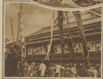
Aus dem Theaterleben Japans. Das Treiben vor dem Stadttheater in Yokohama.