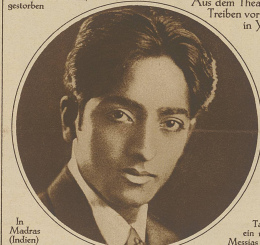
In Madras (Indien) wurde dieser