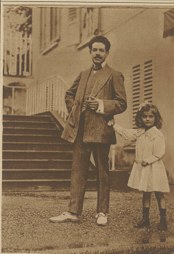
Bild links: Enrico Toselli, der bekannte Pianist, der seinerzeit durch seine Vermählung mit der Kronprinzessin Marie Luise von Sachsen vielverdiene machte, ist im Alter von 68 Jahren in Florenz gestorben.