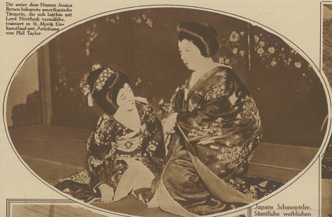
Japans Schauspieler. Sämtliche weiblichen Rollen werden in Japan ausschließlich von Männern gespielt. Unser Bild zeigt zwei bekannte Schauspieler als Damenarsteller.