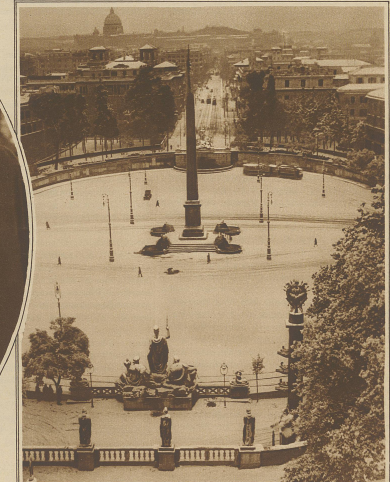
Schnelldurchlauf in Rom. Blick von Pincio auf die Piazza del Popolo; im Hintergrund die Kuppel der Peterskirche.