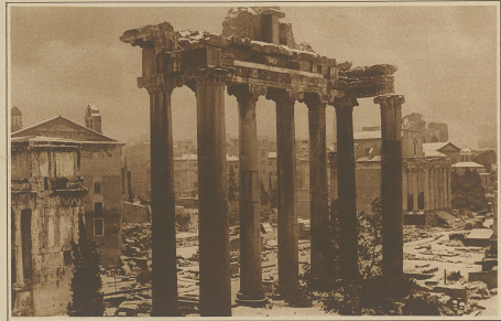
Schnelldurchlauf in Rom. Blick auf das verschnittene Forum Romanum.