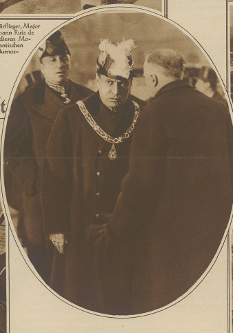
Mussolini in Amtstracht nach seiner feierlichen Investitur als Staatsminister.