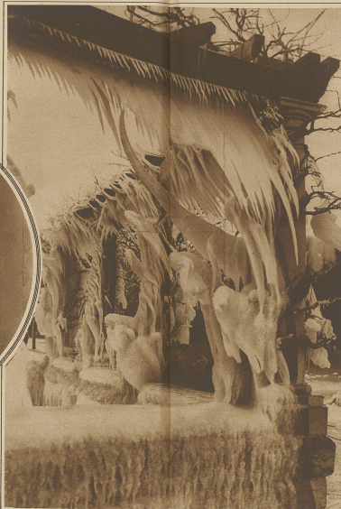
Interessante Eisgebilde an Sequai in Rorschach, die vorige Woche anlässlich der starken Stürme entstanden.