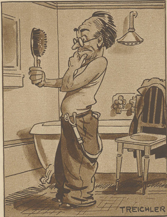
Zerstreut, Meier, der die Bürste statt des Spiegels erwischt: «Pos, ich han nüt gwüß, daß ich s' Rastere so nötig han.»

Die Katze. Der «Tierfreund» veröffentlicht den Schulaufsatz einer 11½-jährigen Schülerin aus Hannover über «Die Katze». «Die Katze pflanzt sich durch Junge fort, welche neun Tage unsichtbar sind. Dann bekommen sie Augen, die Alte setzt sich darauf, sonst frisst sie der Kater zusammen. Die Kätzchen sind sehr possierlich und beschäftigen sich mit Zwirnsknäueln und anderen Umfang. Dann lernen sie Mäuse fangen, indem ihre Krallen unhörbar sind. Die Ohren sind scharf und spitz, um ein Mäuschen zu erwischen. Endlich kommt's aus dem Loche. Dieses läßt sie ein paarmal laufen, bevor sie es frisst. Die Katze ist mit einem verschiedenen Fell überzogen. Sie wird elektrisch, wenn man ihr entgegenfährt. Hinter ihr befindet sich der Schwanz. Dieser wird immer dünner und hört am Ende ganz auf. Mittelst ihrer Krallen ist sie sehr anhänglich und klettert auf die Bäume, wo sie Eier für ihre Jungen fängt.»