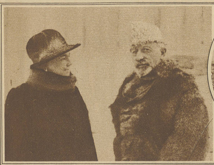
Letzte Aufnahme des deutschen Ex-Kaisers im Schlosspark in Doorn, der durch die Filmaufnahmen einer französischen Gesellschaft in den letzten Tagen wieder zu zweifelhafter Berühmtheit kam