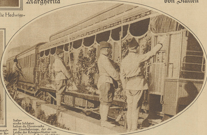
Italienische Soldaten halten die Ehrenwache am Eisenbahnzuge, der die Leiche der Königin-Mutter von Bordighera nach Rom überführt