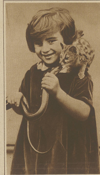
Schöne Leibesübungen eines Kindes. Der Fälscher, der 4-jährige Tochter, ist ein tüchtiger Turner und hat eine eigene Leibesübung, eine Schlinge mit einem kleinen Tier, vor dem sie sich nicht fürchten empfindet.