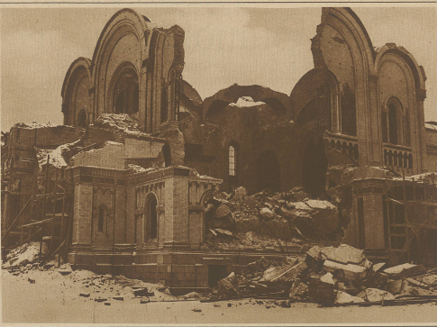
Auch ein Zeichen der Zeit. In Warschau wurde die große russische Kathedrale auf Anordnung der Stadtbehörden mit der Begründung zerstört, daß dieses prächtige Bauwerk an die Sklaverei der russischen Leutnants erinnere.