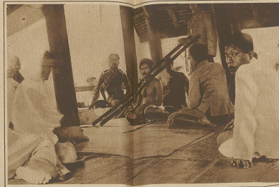
Eine Hinrichtung in Sum. Der zum Tode verurteilte wird vor der Hinrichtung zur Schau gestellt. Als Zeichen seiner Degradierung trägt er ein leiterartiges Gestell um den Hals.