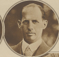
Der ungarische Landespolitische Ratgeber, der von Prinz Windischgrätz als der eigentliche größte Urheber der Fälschungsgelbes bezeichnet wird.