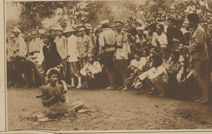
Eine Hinrichtung in Sum. Der Scherfrichter untersucht den Todverurteilten, bevor er zum Hinrichtungsplatz führt. Im Vordergrund rechts steht ein zweiter Scherfrichter in Begleitung. Teile des ersten Hänges sind gegenwärtig auf dem Versteilen zu sehen.