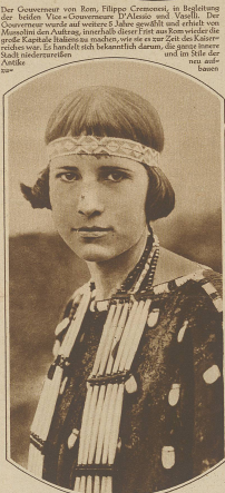
Unter dem letzten noch existierenden Indierstamm wurde kürzlich eine Schönschönheit veranstaltet. Diese erste Preis-Gewinnerin wurde aus dem Indierstamm nachher entlassen. Sie gilt heute noch als schönste, sondern auch als reichste Mädchen ihres Stammes.