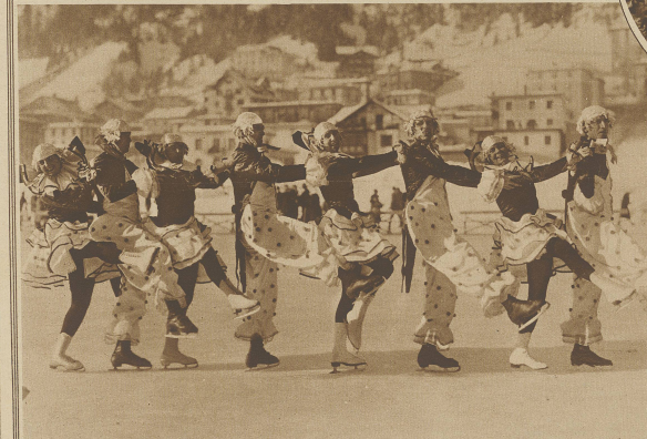
Großes Schaulaufen auf der Davoser Eisbahn. Ein lustiges Holländerdoppelquartett.