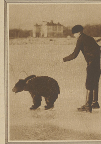
Der neueste Sport in Holland. Während man in Amerika nun stehende Zirkus-Hauptstücke verwendet, wird hier ein als Vespertanz benanntes, der Fahrt geht von einem langsam, ist jedoch sehr nicht weniger elegant.