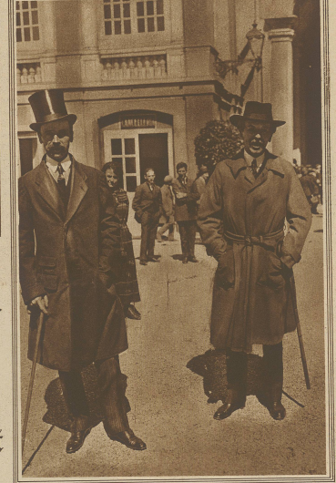
Der ungarische Ministerpräsident Graf Batthyány in Begleitung des Grafen Andrássy. Der Ministerpräsident hat die Leitung der Unternehmung in der Banknotendruckerei selbst in die Hand genommen.