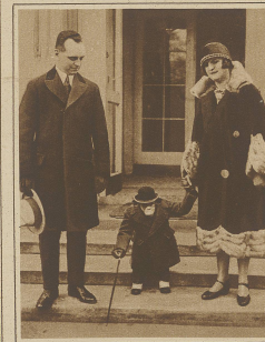
Ein schillerndes Paar beim Präsidenten der Vereinigten Staaten. Dieser Tag statuierte der Schöpfung der Menschheit, der einen Wert von über hunderttausend Dollars repräsentieren soll, dem Präsidenten Coolidge im Weißen Haus in Washington einen Besuch ab. Unser Bild zeigt den illustrierten Gast in Begleitung seiner Begleiter nach der Audienz.