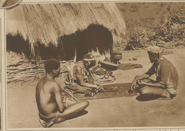
Schach im Kafferkraal. Die Eingeborenen Südostafrikas unterhalten sich vor ihrer Hütte mit einem Spiel, das sehr viel Ähnlichkeit mit dem bekanntlich aus Persien stammenden Schachspiel hat.