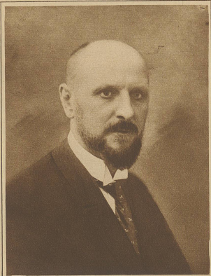
General Zankoff, der als politischer Diktator Bulgariens weit über dessen Grenzen hinaus bekannt wurde, ist als Ministerpräsident zurückgetreten