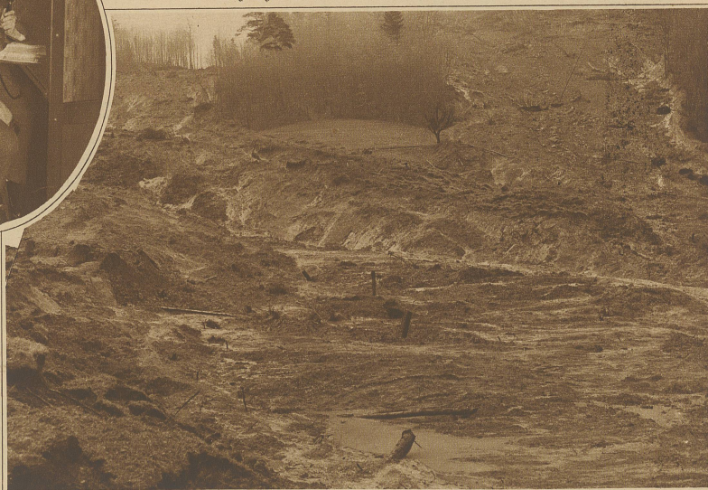
Die beiden Hauptarme im oberen Teil des Abrutschgebietes bei Ittenthal

Nach langen Versuchen ist letzte Woche auf der Strecke zwischen Hamburg und Berlin die Zugtelephonie endgültig für die Öffentlichkeit in Betrieb genommen worden. Es ist jetzt möglich, von Hamburg, Berlin und Wittenberge aus mit dem fahrenden Zuge und umgekehrt vom Zuge aus mit den Abonnenten dieser drei Städte zu telefonieren. Unser Bild zeigt einen Wagen mit den Send- und Empfangsanlagen