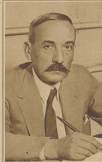
General Pangalos hat sich zum Diktator Griechenlands ausgerufen und die auf diesen Monat angesetzten Parlamentswahlen ausgesetzt