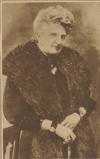
Königin-Mutter Margherita von Italien, die Gattin des durch Mordhand gefallenen König Humbert, ist im Alter von 78 Jahren in Bordighera gestorben