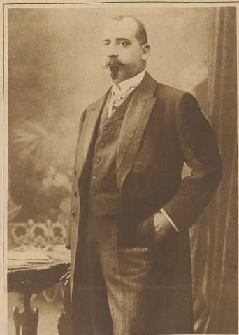
Andrea Liaptscheff, der neue bulgarische Ministerpräsident. Liaptscheff studierte u. a. auch in Zürich Nationalökonomie und Geschichte