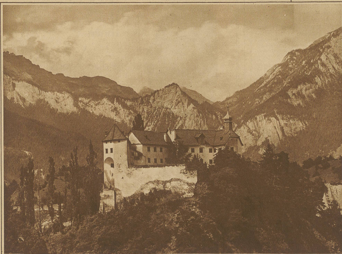
Schloß Rhäzüns, eines der schönsten Schweizer Schlösser, ist von einer Genossenschaft der Auslandschweizer-Organisation der Neuen Helvetischen Gesellschaft angekauft worden und soll nach vollzogenen Renovationsarbeiten durch Architekt Probst vom nächsten Frühjahr an als Ferienheim für Auslandschweizer dienen