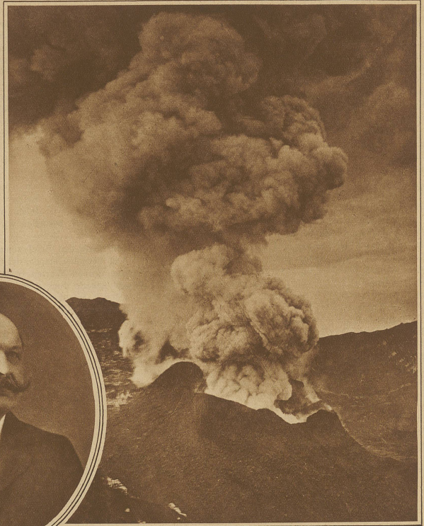
Momentbild starker Eruption während des neuesten Ausbruchs des Vesuvus