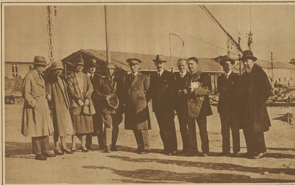
Die Expeditionsteilnehmer im Kreise der Behördevertreter von Neapel und der dort ansässigen Landsleute