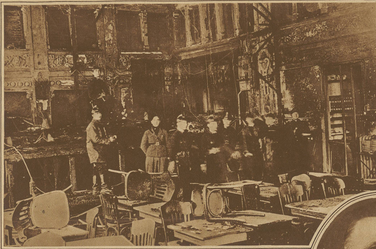
Theaterbrand in Rom. Das prächtige Apollotheater fiel einer großen Brandkatastrophe zum Opfer, wobei vier in ihren Kabinen sich aufhaltende Künstlerinnen den Erstickungstod fanden