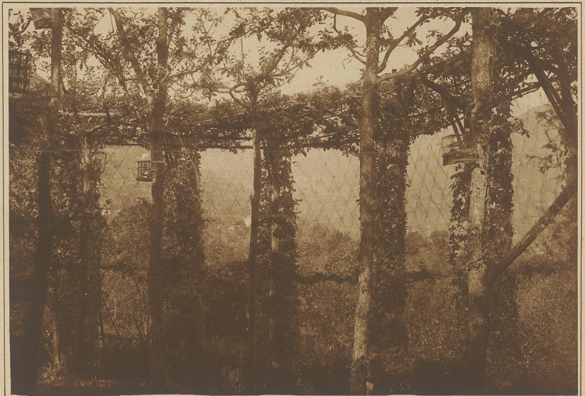
Innenansicht eines «Roccolo»

lenartiges, aus Schlingpflanzen hergestelltes Rondell, in dessen Mitte kunstgerecht geschnittene Bäume ein kuppelähnliches, nicht zu enges Dach bilden. Die den Fenstern gleichenden Zwischenräume werden im Innern der Rundlaube mit einem weitmaschigen Netz überspannt und dieses in einem Abstand von ungefähr 20 cm von einem zweiten, engmaschigen Netz überdeckt.