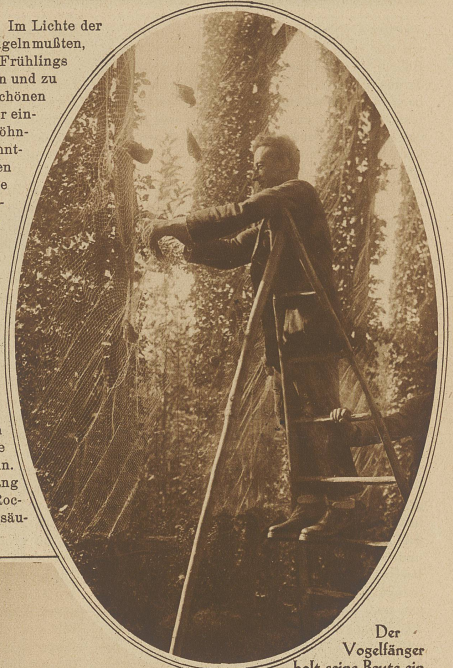
Der Vogelfänger holt seine Beute ein

rättern an ihrem gefiederten Völklein. Im Lichte der Herbstsonne, die sie ein ganzes Jahr mangeln mußten, wird in ihnen das Gefühl des nahenden Frühlings wachgerufen und sie beginnen zu singen und zu jubilieren, wie die Lerchen an einem schönen Maimorgen. Der Mensch ist also wieder einmal schlau und der Vogelfänger, der gewöhnlich ausgezeichnete ornithologische Kenntnisse besitzt, ist mit den Wanderzeiten und Gebräuchen der Vögel aufs Beste vertraut und er verwendet auch die entsprechende Gattung von Lockvögeln. Der durchtriebene Vogeljäger ahmt aber selbst mit allen möglichen Pfeifchen, Zirp- und Trillerinstrumenten den Gesang der Vögel nach, dessen täuschende Wiedergabe nicht wenig zu seinem Erfolge beiträgt. Eine andere Art des Vogelfanges sind die Leimruten. Wie es der Name verrät, werden Ruten mit Vogelkleim bestrichen, an denen die armen Vögel kleben bleiben. Gewöhnlich wird hier am Ende einer Stange an einem Schnürchen ein Vogel so angebunden, daß er eine kleine Strecke hin und her flattern kann. Wenn man vom italienischen Vogelfang berichtet, darf man auch den sog. «Roccolo» nicht vergessen. Es ist dies ein säu-