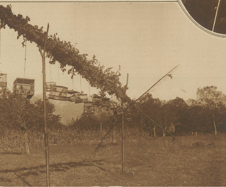
Ein umgekippter Palone

gefüttert, oder von bösen Menschen verzaubert würden. Ihr gegenüber war das Sprichwort: «Geh' nicht auf den Leim» richtig angebracht, das ohnedies aus der Zeit des Vogelfanges stammt. / Nun aber zum italienischen Vogelfang. Voraus schicken möchte ich, daß das Fangen der Vögel wohl in keinem Lande mehr mit größerem Eifer und Interesse ausgeübt wird, als gerade in Italien. Der Vogelfang kann hier tatsächlich als Sport bezeichnet werden und es wird jährlich von berufsmäßigen Vogelfängern eine Beute von ungefähr 90 Tausend Vögeln eingebracht.