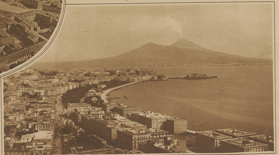
Neapel und der Vesuv, dessen Eruptionen neuerdings stärker eingesetzt haben

Nach den wiederholt mißglückten Versuchen der Alpen traversierung gelang endlich letzten Dienstag vormittags das Ueberfliegen des Gott-hardmassivs. Leider zwang auch diesmal wieder eine Kühlerpanne, die allerdings bald zur Zufriedenheit behoben werden konnte, zu vor-zeitiger Landung auf dem Meere in der Nähe von Marina di Carrara. Nach kurzer Reparatur konnte der Flug nach Pisa und am andern Morgen nach Neapel, dem ersten Etappenorte, fortgesetzt werden