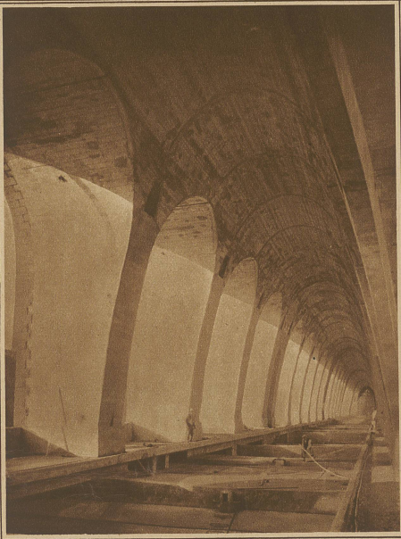
Blick ins Innere der Brücke, das als Tracé der Eisenbahnlinie dienen soll

der an Stelle Grimms zum Präsidenten des Nationalrates gewählt wurde