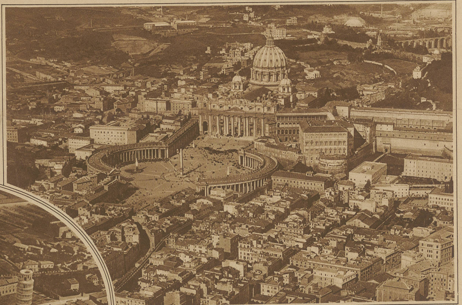
Fliegeraufnahme von Rom mit der Peterskirche