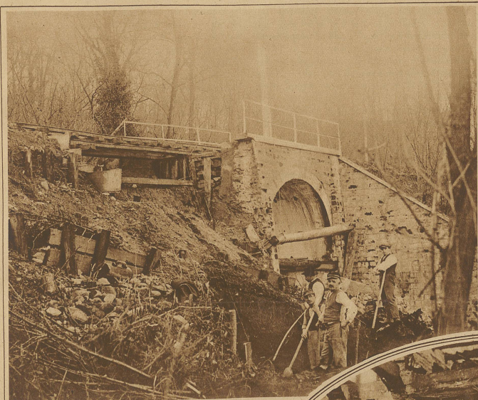
Durch die andauernden starken Regengüsse am Südfusse der Alpen wurde an der Bahnlinie Ponte Tresa-Varese ein Brückenkopf unterpült und weggerissen. Der Umsicht des Lokomotivführers, der den Zug noch rechtzeitig bremsen konnte, ist es zu verdanken, daß ein schreckliches Unglück verhindert wurde.