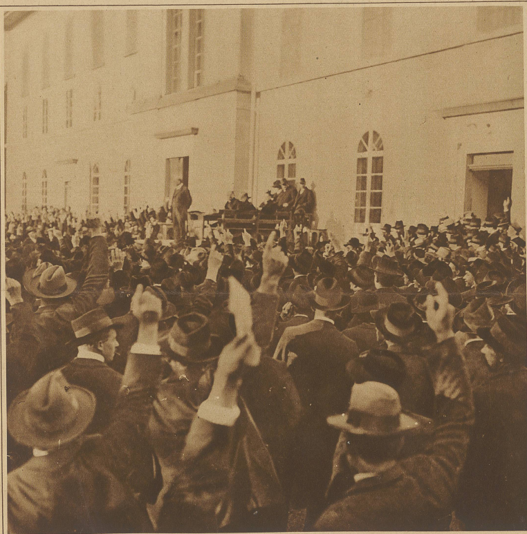
Die Bezirksgemeinde von Einsiedeln stimmt der Konzessionserteilung für den Bau des Sihlsees mit bedeutendem Handmehr zu.