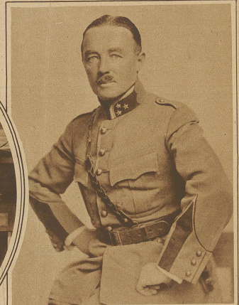
Oberstdivisionär Henri Guisan, der als Nachfolger Sarasins zum Kommandanten der 2. Division ernannt wurde.