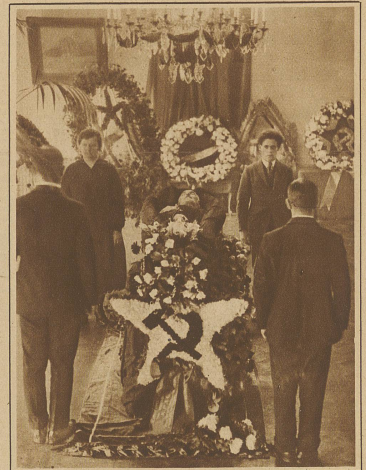
Die Ehrenwache am Sarge Krassins in London