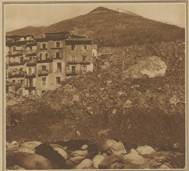
DER BERGSTURZ VON ROQUEBILLIÈRE Infolge der heftigen Regenfälle entstand oberhalb des Dorfes Roquebillière in der Nähe von Nizza ein etwa 1 Kilometer langer Riß in der Erde, wodurch eine riesige Stein- und Kotmasse sich löste, ins Dorf eindrang und die Gebäude wie Kartenhäuser zermalmete. 25 Tote liegen unter dem Schutt begraben. Der Inhalt der abgestürzten Schuttmassen wird auf 3 Millionen Kubikmeter geschätzt