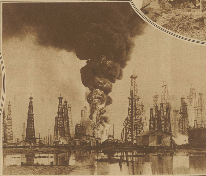
Brand eines Oelfeldes in Texas