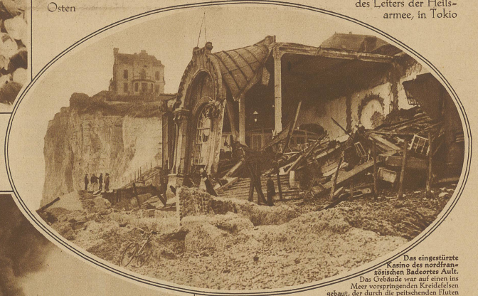
Das eingestürzte Kasino des nordiranischen Beskovo. Das Gebäude war auf einen ins Meer vorspringenden Klippenfelsen gebaut, der durch die peitschenden Fluten der Novemberstürme zum Einsturz gebracht wurde