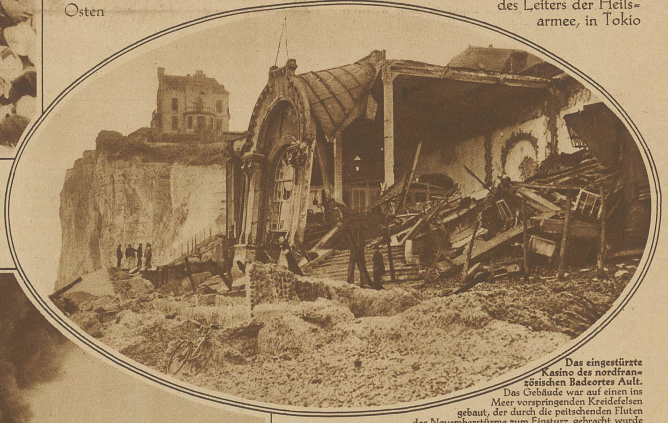
Das eingestürzte Casino des nordfranzösischen Badeortes Ault. Das Gebäude war auf einen ins Meer vorspringenden Kieffelsen gebaut, der durch die peitschenden Fluten der Novemberstürme zum Einsturz gebracht wurde