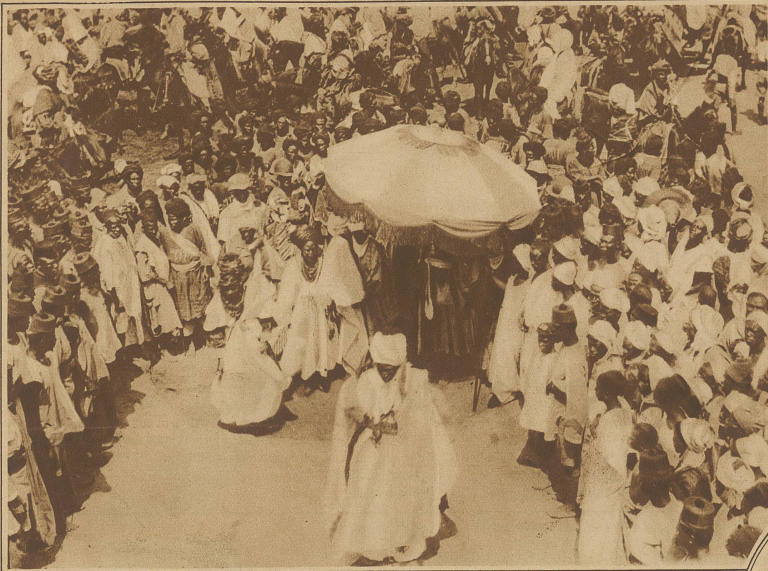
Empfang des Emirs von Zaria auf der Inspektionsreise durch seine afrikanischen Untertanengebiete