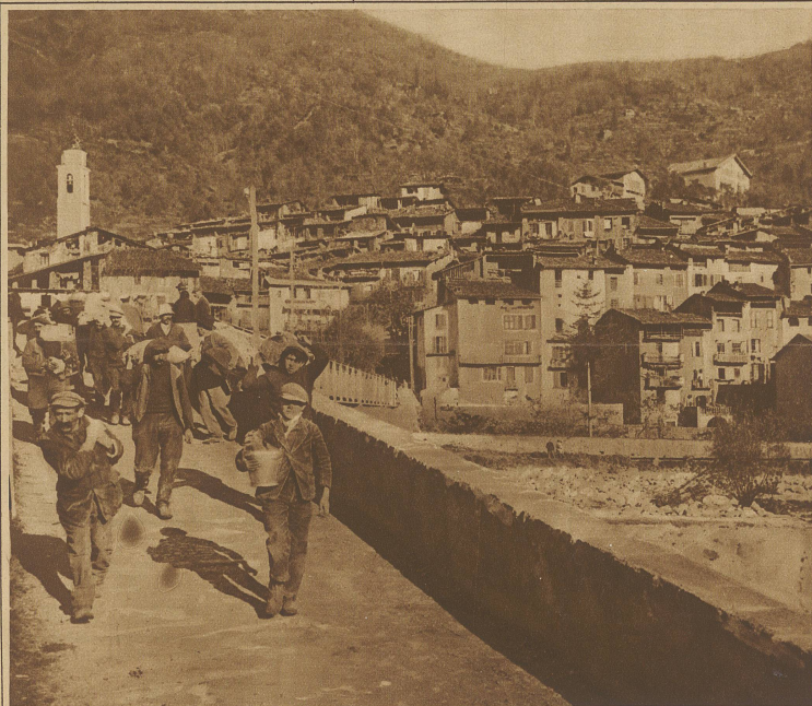
Die Bevölkerung flüchtet aus dem noch unversehrt gebliebenen Dorfteil, der durch wahrscheinliche weitere Rutschungen ebenfalls bedroht ist