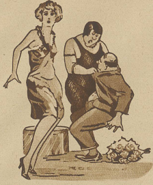
„Jetzt habe ich Dich erpapt, Du Elender, ich werde Dich lehren, unserem Dienstmädchen Präsente zu machen.“ „Aber, liebes Frauchen, Du hast doch selbst gesagt, ich soll dem frechen Ding einmal ordentlich den Mund stopfen.“

«Schließt sofort das Fenster, denn wenn einer rausfällt, ist's nachher wieder keiner gewesen!»