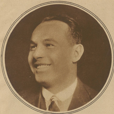
Jan Kiepura, dessen sensationelle Gastspiele an der Wiener und Berliner Oper ihm den schmeichelhaften Titel des Nachfolgers von Caruso eingetragen haben. Kiepura ist polnischer Student