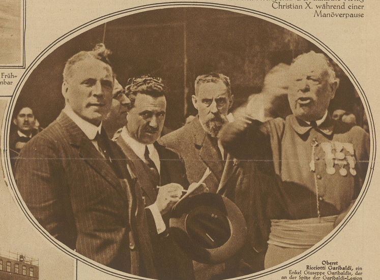
Oberst Ricciotti Garibaldi, ein Enkel Giuseppe Garibaldis, der an der Spitze der Garibaldi-Legion stand, wurde als Faschistenspißel entlarvt. Er genoss als Antifaschist und Führer der Republik die Demokratisierung von Antifaschisten 400000 Franken Judasgelder. Es scheint feststehend, daß Garibaldi auch beim katalonischen Putschversuch die Hände im Spiel hatte. Unser Bild zeigt Ricciotti Garibaldi (links im Bilde) während der Ansprache eines alten Garibaldianers