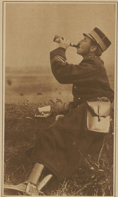
In einem demokratischen Königreich. Der dänische König Christian X. während einer Manöverpause