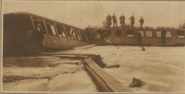
Die großen Überschwemmungen im Tirol haben auch die Eisenbahnlinie Bozen-Meran unterspült, so daß der Meraner Frühzug in der Dunkelheit abstürzte. Der strengen Zensur wegen waren bis zur Stunde keine genauen Angaben über die offenbar erhebliche Zahl der Opfer erhältlich. Nach einer Meldung aus Innsbruck sollen 20 Personen ertrunken sein