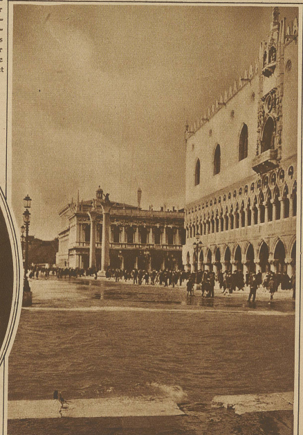
Auch Venedig hat unter dem Hochwasser der letzten Woche schwer gelitten. Unser Bild zeigt die seltene Aufnahme des überschwemmten Markusplatzes, der stellenweise nur auf Stegen passiert werden konnte