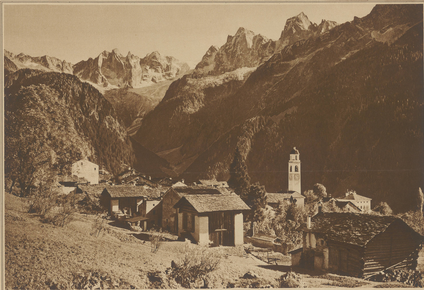
SOGLIO IM BERGELL