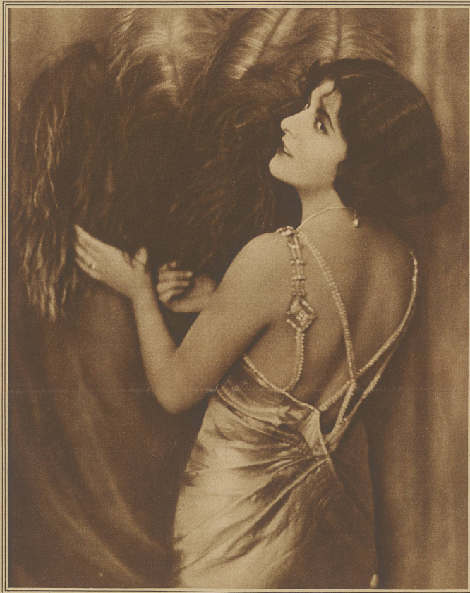
BILDNIS EINER SCHÖNEN FRAU

Aber was bedeuteten alle Bedenken, wenn eine schöne Frau wartete, und liebe Augen verhei-