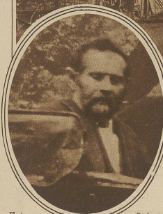
Benedikt Kramer das Opfer des Raubmordes in Gams