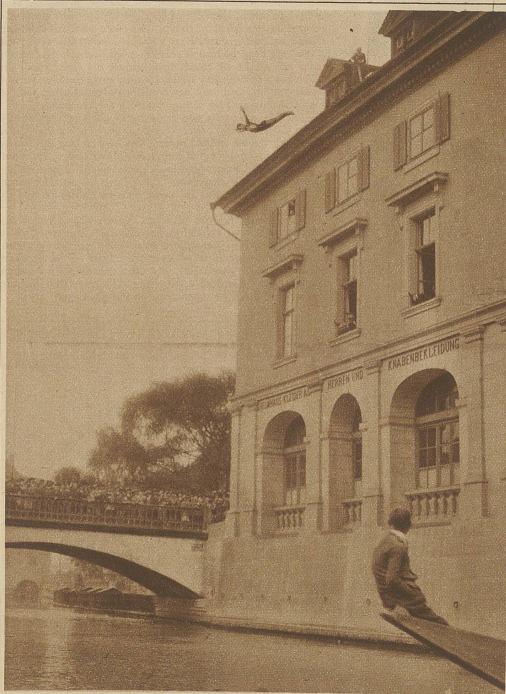
Teddy Kündig, ein junger Schweizer-Amerikaner, sprang letzte Woche im Beisein einer großen, sensationslustigen Zuschauermenge vom Dache des Helmhauses herunter in die Limmat