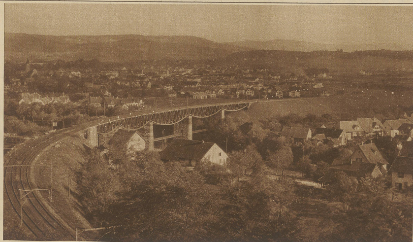
Blick auf die für die elektrische Traktion verstärkte Aarebrücke bei Brugg