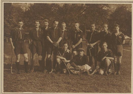
Der Red Six-Hockeyclub, der 5:0 gegen Schaffhausen gewann