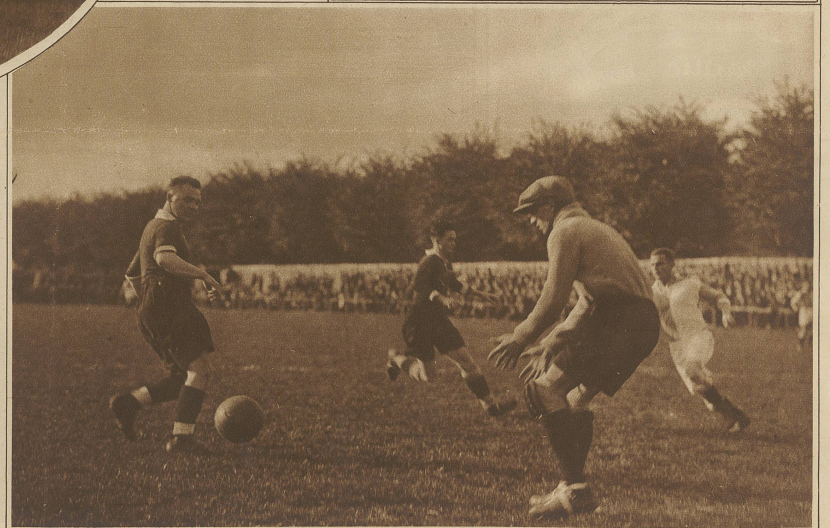
Kritische Situation vor dem Tor der Zürcher