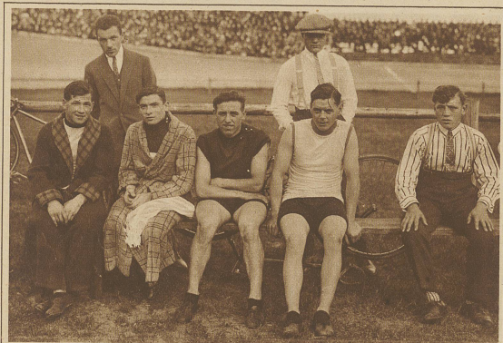
Die vier Teilnehmer am Amateurländermatch Italien-Schweiz