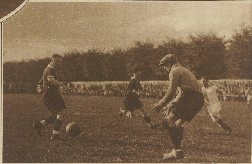
Kritische Situation vor dem Tor der Zürcher