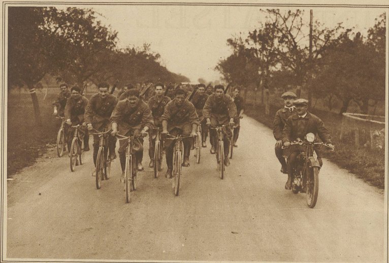
Die Kopfgruppe der Soldaten auf der Fahrt nach Aarau