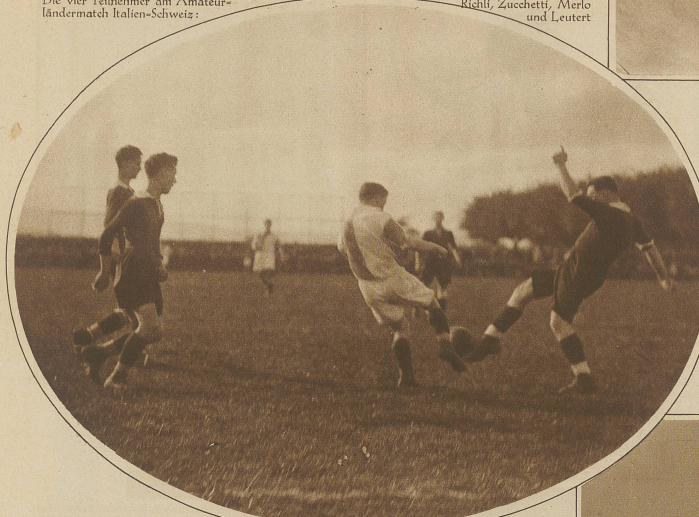
Szene aus dem Spiel