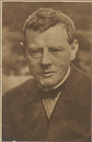
Heinrich Federer, einer unserer bekanntesten Schriftsteller, feierte am 7. Okt. seinen 60. Geburtstag