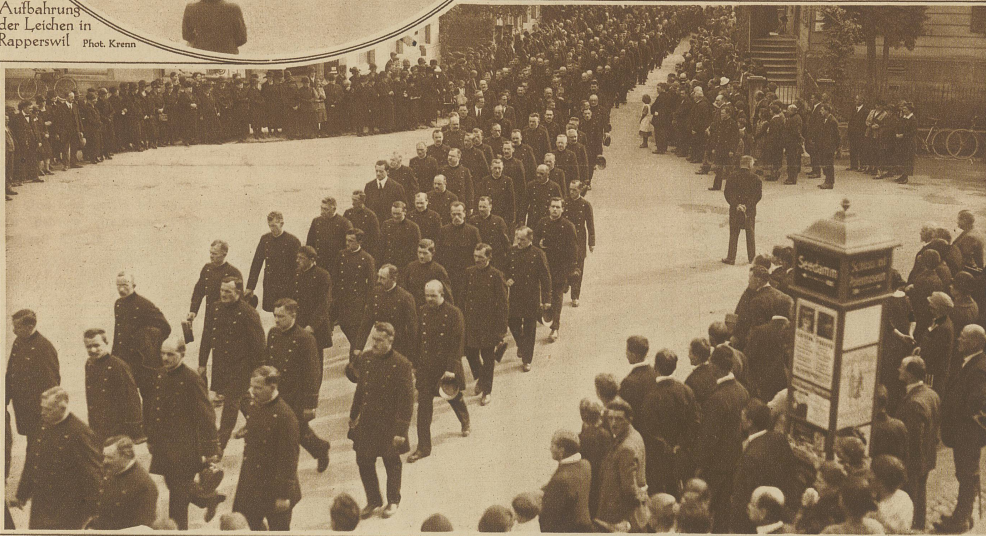
Die Abordnungen der Bundesbahngestellten im Trauerzuge