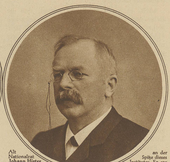
Alt-Nationalrat Johann Hirter ist letzten Montag in Bern im Alter von 71 Jahren gestorben. Hirter war in hervorragender Weise an der Schaffung der Schweiz, Nationalbank beteiligt und stand von 1907 bis 1928

sind vor allem seine umfangreichen Vorträge für das eidgenössische Strafrechtshandbuch hervorzuheben, das endlich einmal an die Stelle der teilweise veralteten kantonalen Strafrechtstexten soll