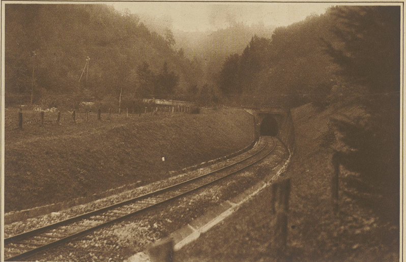
Blick auf den Eingang zum Ricken-tunnel auf der Kaltbrunner Seite, wo der bei Kilometer 4 stecken gebliebene Unglückszug einfuhr