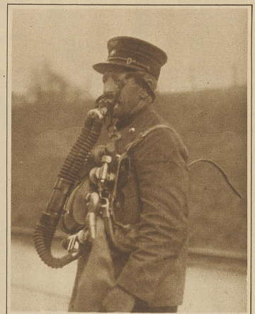
Ein Streckenwärter mit dem Sauerstoffapparat, wie er bei der ersten Rettungsaktion leider erfolglos zur Verwendung gelangte