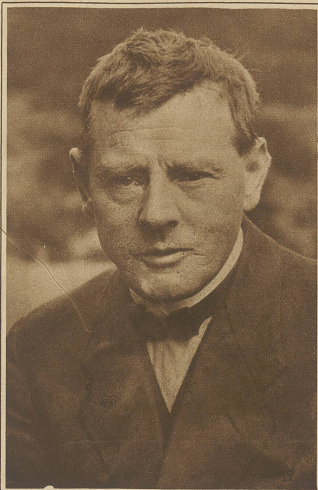
Heinrich Federer, einer unserer bekanntesten Schriftsteller, feierte am 7. Okt. seinen 60. Geburtstag