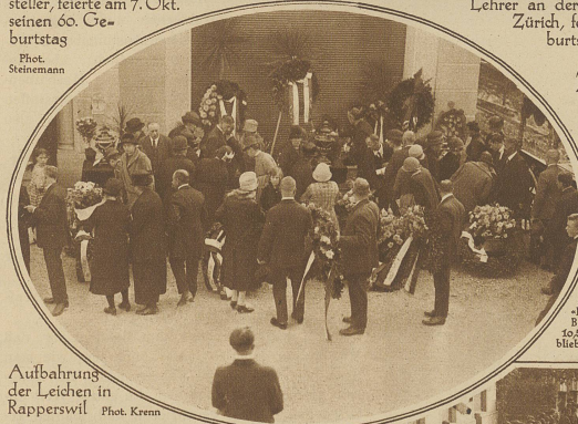
Aufbahrung der Leichen in Rapperswil

an der Spitze dieses Institutes. Er erworb sich weitere große Verdienste um die Verstaatlichung der großen schweizerischen Eisenbahnen und um das Zustandekommen der Kranken- und Unfallversicherung