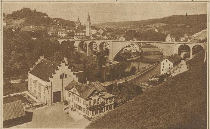
Die neue Hochbrücke in Baden, die letzte Woche dem Verkehr übergeben wurde