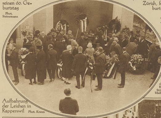
Aufbahrung der Leichen in Rapperswil

an der Spitze dieses Institutes. Er warb sich weitere große Verdienste um die Verstaatlichung der großen schweizerischen Eisenbahnen und um das Zustandekommen der Kranken- und Unfallversicherung