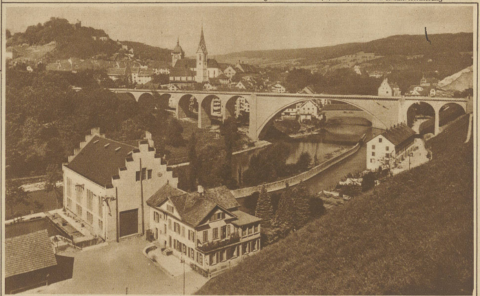
Die neue Hochbrücke in Baden, die letzte Woche dem Verkehr übergeben wurde