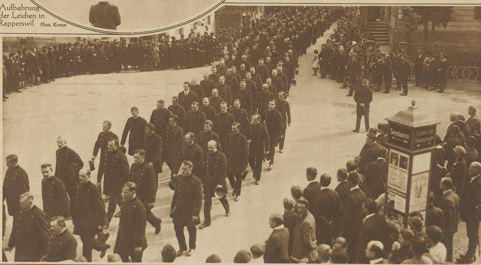
Die Abordnungen der Bundesbahngestellten im Trauerzuge