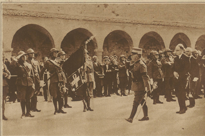
Zur Jahrhundertfeier in Assisi. Der König von Italien begibt sich zum Grab des heiligen Franziskus