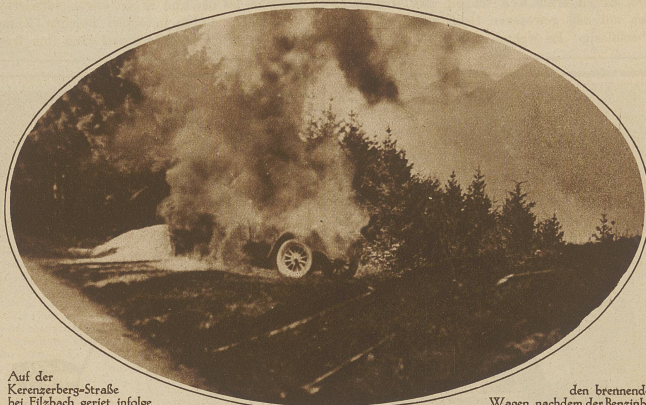
Auf der Kerenzerberg-Straße bei Filzbach geriet infolge Überhitzung ein Auto aus Zürich in Brand und wurde vollständig zerstört. Unser Bild zeigt den brennenden Wagen, nachdem der Benzinbehälter zur Vermeidung einer Explosion durch einen Gewehrstoß geöffnet wurde.