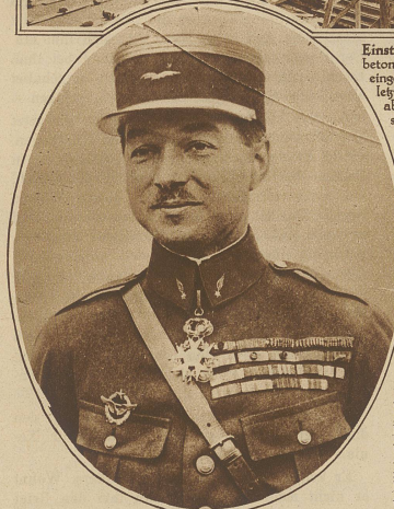
Der französische Fliegerhauptmann René Fonck

Foncks Ozeanflug mißglückt. Der seit Monaten vorbereitete Ozeanflug New York-Paris des französischen Fliegerhauptmanns Fonck hat ein jähes Ende gefunden. Kaum hatte sich der mit 7000 kg Benzin und Öl beladene Apparat einige Meter über dem Boden erhoben, stürzte er plötzlich vornüber, um sofort in Flammen aufzugehen. Fonck und der amerikanische Flieger Curtin konnten sich durch rechtzeitiges Abspringen retten, während der Mechaniker und der Funker den Flammentod erlitten. Das Unglück wird mit der übermäßigen Belastung des Apparates begründet.