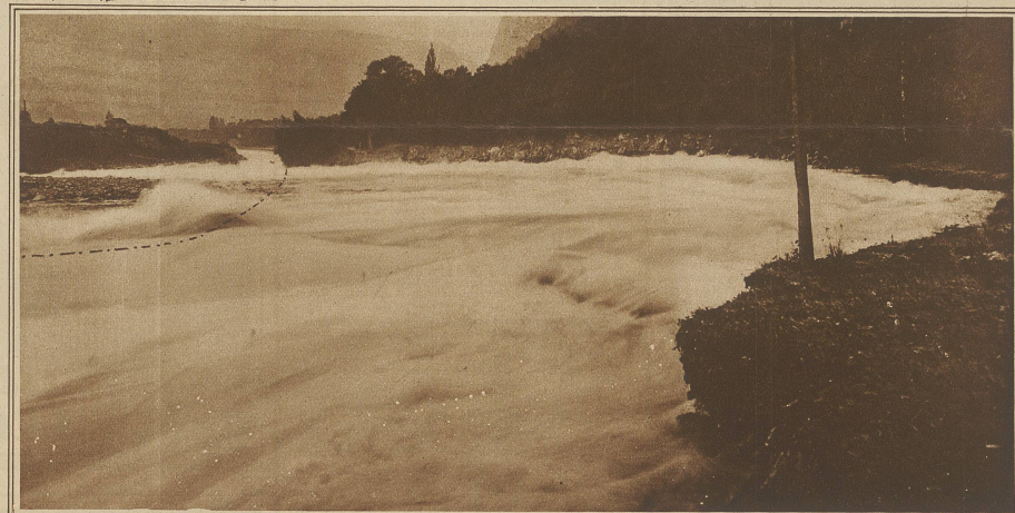
Der Bergsturz an der Dent du Midi. Infolge eines letzten Samstag niedergegangenen Felssturzes bildete sich am Plan-Névé-Gletscher im Quellgebiet des Barthelém-Wildbaches ein kleiner See. Weitere Abstürze führten am Montag zum Durchbruch der absperrenden Geröllwand und die Fluten ergossen sich, alles verheerend, zu Tal. Das auf 20000 m 3 geschätzte mitgeführte Gestein füllte, wie in unserem Bilde ersichtlich, das Flußbett der Rhone zum größten Teil auf, so daß sich der Fluß auf der waadtländischen Uferseite einen neuen Lauf suchen mußte und die mit prächtigen Bäumen bewachsene Parkanlage von Lavey-les-Bains überflutet und weggriff. Über den Umfang dieses Teils der Katastrophe orientiert die strichpunktierte Linie, die den früheren Verlauf des Flußufers bezeichnet.