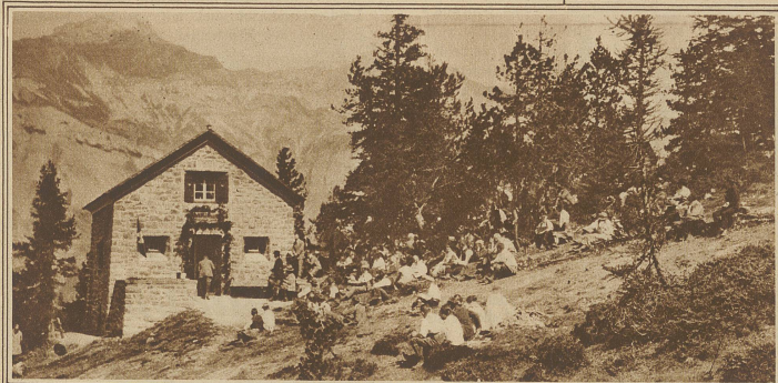
Einweihungsfeier der neuen S.A.C.-Klubhütte der Sektion Emmental am Doldenhorn