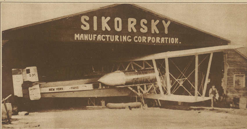
Das Sikorsky-Flugzeug Foncks vor dem Hangar

Foncks Ozeanflug mißglückt. Der seit Monaten vorbereitete Ozeanflug New York-Paris des französischen Fliegerhauptmanns Fonck hat ein jähes Ende gefunden. Kaum hatte sich der mit 7000 kg Benzin und Öl beladene Apparat einige Meter über dem Boden erhoben, stürzte er plötzlich vornüber, um sofort in Flammen aufzugehen. Fonck und der amerikanische Flieger Curtin konnten sich durch rechtzeitiges Abspringen retten, während der Mechaniker und der Funker den Flammentod erlitten. Das Unglück wird mit der übermäßigen Belastung des Apparates begründet.