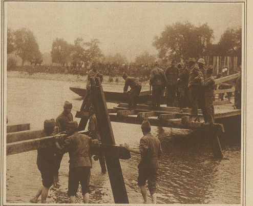
Pontoniere beim Brückenschlag über die Reuß zwischen Bremgarten und Eggenwil