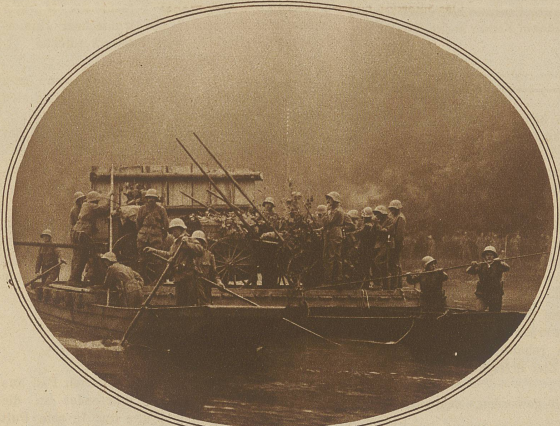
Rote Infanterie-/Mitrailleure werden beim Morgengrauen auf einer Fähre bei Brem- garten übergesehen