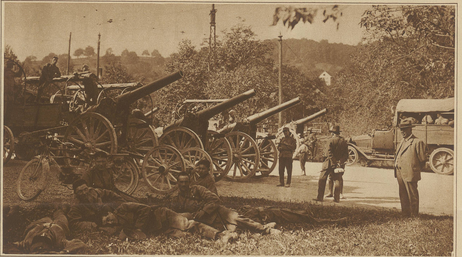
Schwere 12 cm-Motorbatterie in Reservestellung in Rudolf- stetten