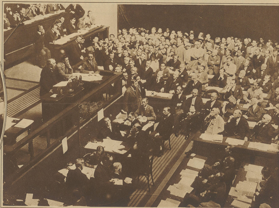
Briand antwortet in meisterhafter Rede auf die Ansprache Stresemanns (x)