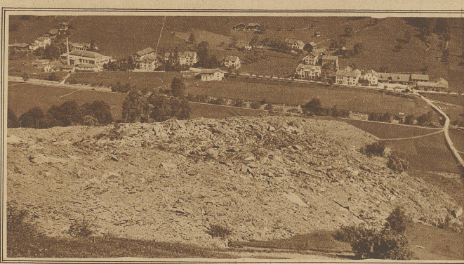
Die bis auf wenige Meter an die Serntal vorgedrungenen Schuttmassen mit dem Dörfchen Engi