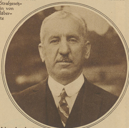
Nintschitsch, der Präsident der gegenwärtigen Versammlung des Völkerbundes