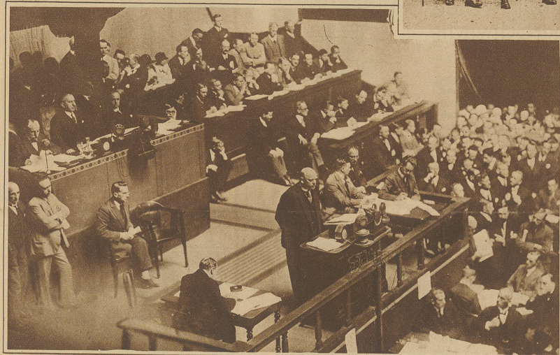
Der deutsche Außenminister Stresemann hält seine dankwürdige erste Rede in der Völkerbundsversammlung