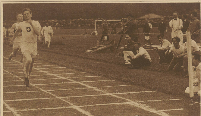
Martin, Schweiz, gewinnt in überlegener Form den 800 m-Lauf in 1 Min. 54,5 Sek.