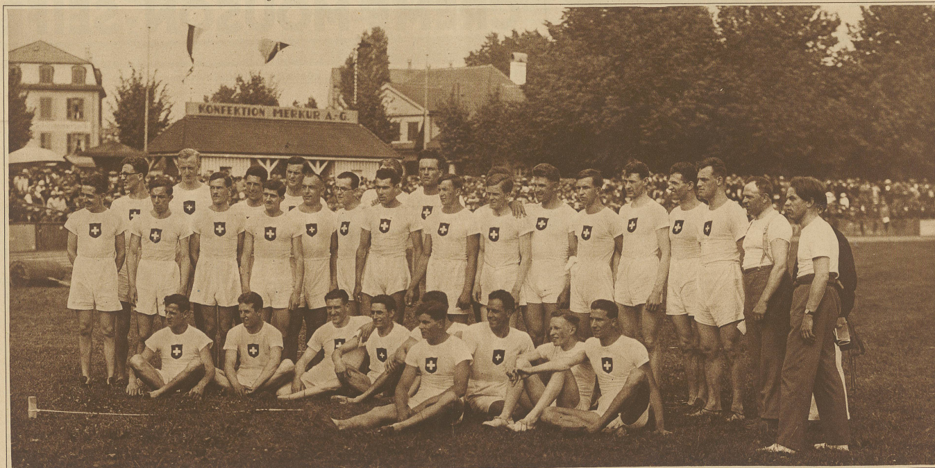
Die schweizerische Nationalmannschaft