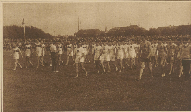
Der Einmarsch der Wettkämpfer