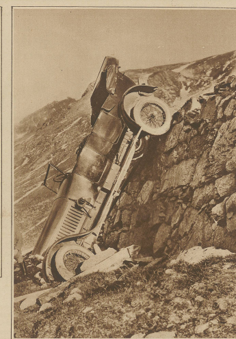
Glück im Unglück. hatten letzte Woche die 6 Insassen einer Daimler Autos, das unterwegs gegen Sie über die Brückenmauer stürzte. Die Passagiere kamen mit dem Schrecken und einigen Schlägungen davon