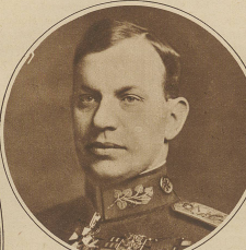
Der abberufene Generalstabchef Ogilby, Spionagegeheimnis gestanden zu haben