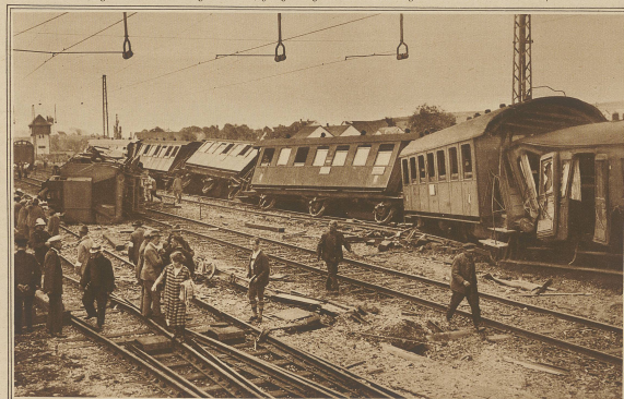
Auf dem Schauplatz der Katastrophe