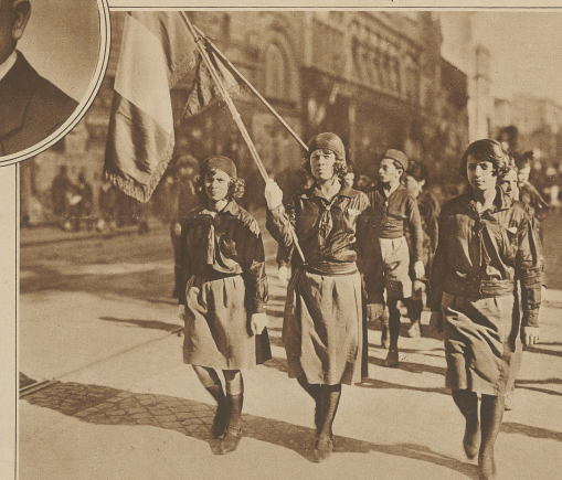
Mussolini will kein Amazonasheer. Die faschistische Partei gab kürzlich eine Verfügung heraus, wonach den weiblichen Faschisten das Tragen der schwarzen Hemden verboten wird. Unser Bild zeigt uniformierte Faschistinnen in einem Protestzug gegen das Verbot