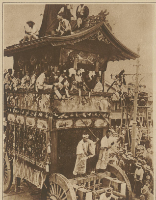
Wie man im Orient Feste feiert. Festwagen aus den Umzug anlässlich des berühmten japanischen Festes Oon Miyako, an welchem jeweils die ganze Bevölkerung teilnimmt