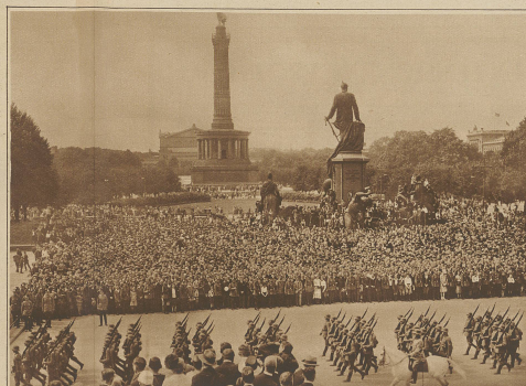
Aus der deutschen Verfassungsfeier. Vorbeimarsch der Truppen vor dem Reichstag