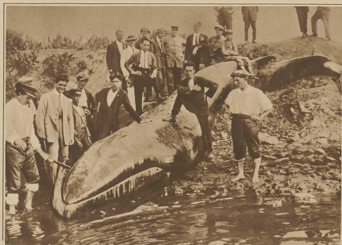
Ein Walfisch im Mittelmeer erlegt. Die Fischer von Portoferraio auf der Insel Elba erlegten dieser Tage einen Walfisch von 11,5 m Länge, der sich aus den nördlichen Gewässern ins Mittelmeer verirrt hatte