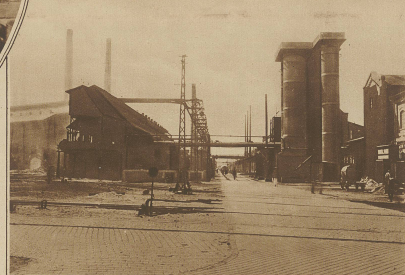
Furchbare Munitionsexplosionkatastrophe in Budapest. Ansicht der Manfred Weiß'schen Munitionsfabrik auf der Donauinsel, die vollständig in Trümmer gelegt wurde