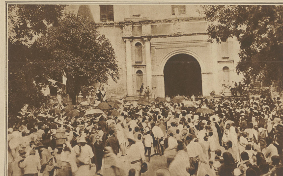
Zum Kulturkampf in Mexiko. Demonstranten vor einer Kirche der Hauptstadt Mexiko