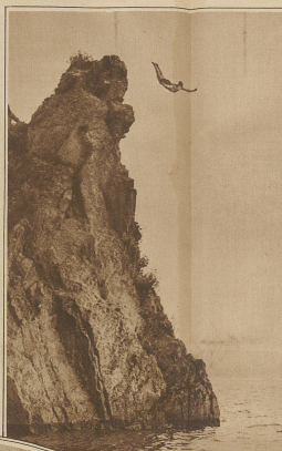
Miß Belle White, die bekannte englische Schwimm-Meisterin, wann letzte Woche im Auftrage eines Filmunternehmens vom 80 m hohen Zandolazellen im Meer