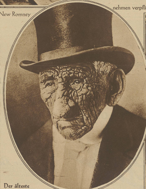
Der älteste Mensch der Welt