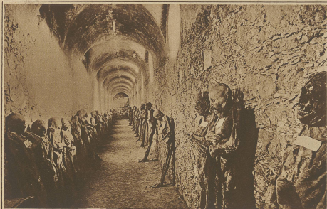
Mumien in einem Kellergewölbe der Stadt Mexiko