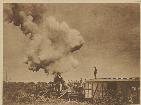
Amerikanische Freiwillige bei einer Schießübung mit einem schweren Eisenbahngeschütz