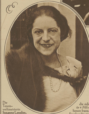
Die Tennisweltmeisterin Suzanne Lenglen