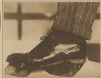
Kohlensäure für Verbrechen. Unser Bild zeigt an den Schultern befestigte Holzkübel, die im Boden abgedrückt, von den Kolliditen rauchend, hinterlassen, auf diese Weise gelang es den Verbrechern, die Spuren von Taten zu verwischen