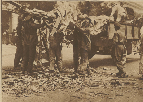
Leichte Woche stürzte ein Flugzeug mitten in die Stadt Mailand ab, glücklicherweise ohne auf der belebten Straße vorbeigehende Passanten zu treffen. Das Aufräumen der Trümmer