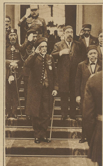
Nach dem Sultan von Marokko ist nun auch der Rat von Tunis in Tunis eingetroffen, um seine Aufgaben zu erfüllen. Unser Bild zeigt den nach seinem Empfang beim Präsidenten Doumergue