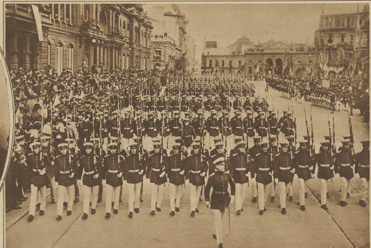
Argentinische Nationalfeier. Der Parademarsch der Kadetten