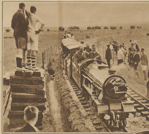
Der Herzog von York als Lokomotivführer auf der kleinsten Eisenbahn der Welt, die in New Romney anlässlich eines großen Schiffsfestes gebaut wurde