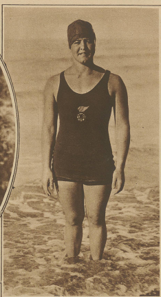
Georg von England als Steuermann auf seiner Yacht Britannia anlässlich einer großen Regatta in Cowes