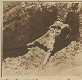
In der Nähe von Hapel wurde bei Erstellung von Fundamenten in einer Tiefe von etwa 20 Metern das Skelett eines toten Menschen ausgegraben. Unser Bild zeigt den 8. März, seinen Schädel mit den Schädelknochen, die eine Länge von mehr als 1,50 Meter aufwiesen