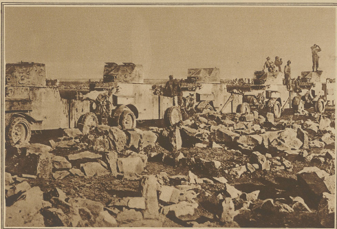
Zu den Kämpfen in Syrien. Französische Panzerautos in Gefechtsstellung