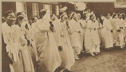
Eine pomphafte Beisegung in Korea. Hofdamen in Trauergewändern