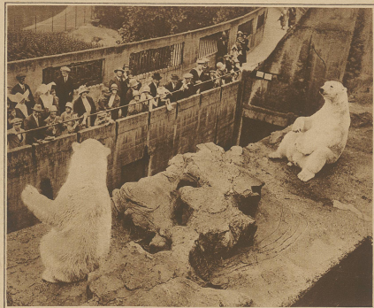
Bettende Eisbären im Londoner Zoo