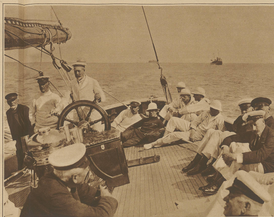
König Georg von England als Steuermann auf seiner Yacht Britannia anlässlich einer großen Regatta in Cowes