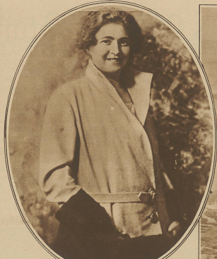
Die unbekannte Frau des weltberühmten Mannes. Wie erst kürzlich aus Mailand in allen Pressen und bei allen Zeitungslesern bekannt geworden