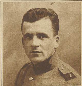
Der beim Autounfall bei Dübendorf getötete Fliegerleutnant Busigny