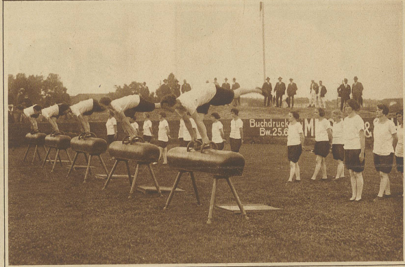
Schweiz. Arbeiter-Turn- und Sportfest in Bern