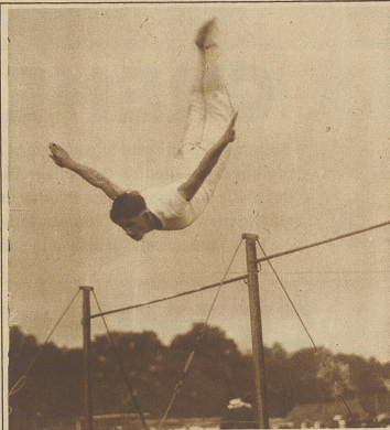
Henzi, Wipkingen, beim Reckturnen