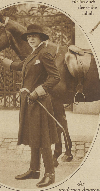
der modernen Amazone

Selbst ist die Frau. Leichter Mantel über dem Abendkleid. Große Abendtoilette mit Hermelinecape